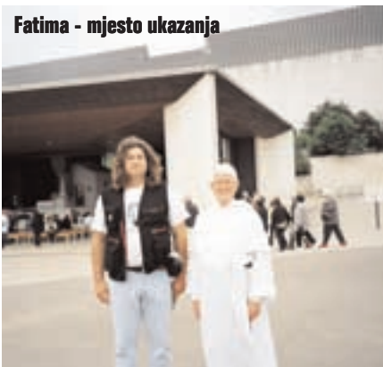
Fatima - mjesto ukazanja

rečeno gotovo ništa. Što se mene tiče, ja još baratam s malo engleskog, ali Portugalci gotovo ništa, tako da se dobar dio razgovora svodio isključivo na gestikuliranje rukama. Sve u svemu, ekipa je prva liga. Malo nakresani, razilazimo se u sitne sate nakon čega na spavanje odlazim "mrtav" umoran i cijelu noć spavam snom pravednika.