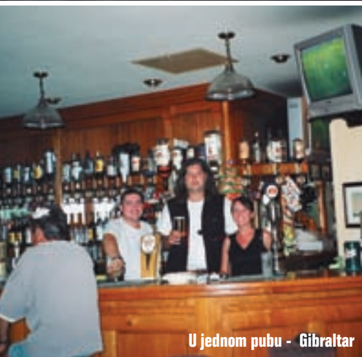
U jednom pubu - Gibraltar

znaju za Hrvatsku jer sam im objasnio kako sam stigao do Gibraltara. Pitaju me imam li rezervaciju u nekom hotelu. Ja im kažem da nemam na što me oni upozoravaju da na Gibraltaru nije dozvoljeno spavati na otvorenom i u vreći za spavanje. Na to im ja odgovaram da ako nemam rezervaciju ne znači da nemam i novca, te da mi je u svakom slučaju namjera naći sobu u nekom od hotela. Povrh svega još sam im na čistom hrvatskom jeziku rekao: "Hadžija u svijet bez novaca ne ide!". Vjerovali ili ne, sve su shvatili vrlo dobro te mi dali potvrdu s kojom u slijedećih 15 dana mogu bezbroj puta prijeći tu granicu.