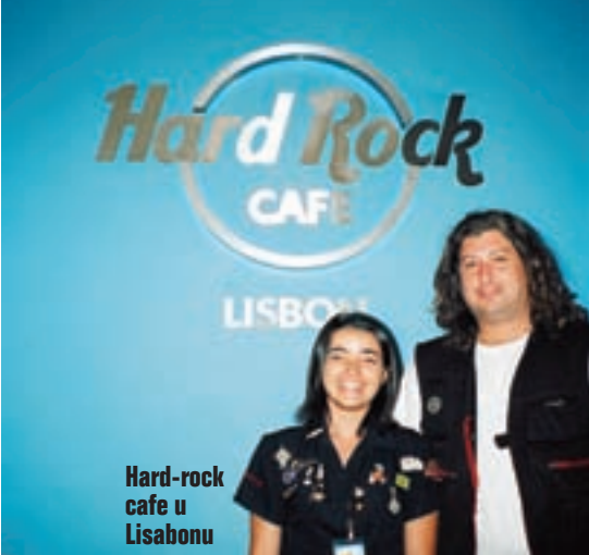
Hard-rock cafe u Lisabonu