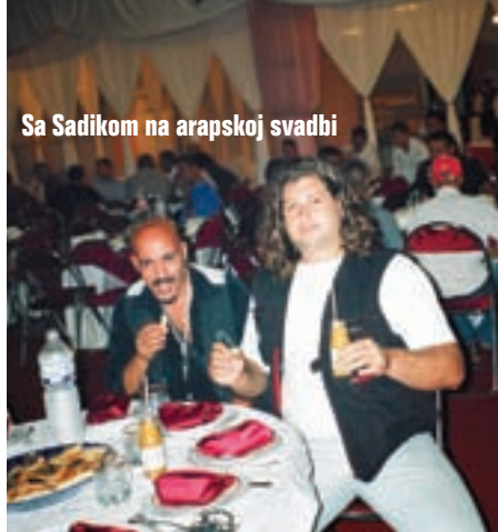
Sa Sadikom na arapskoj svadbi