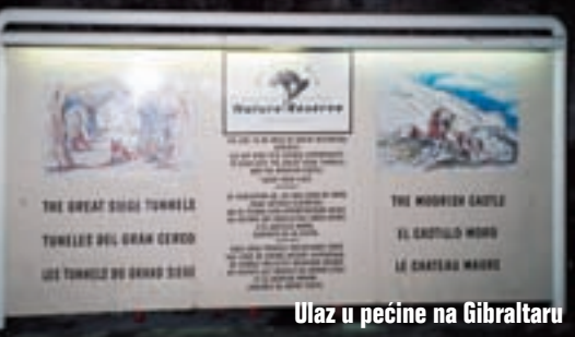
Ulaz u pećine na Gibraltaru