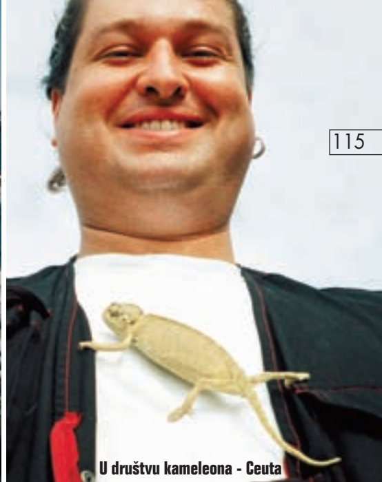
U društvu kameleona - Ceuta