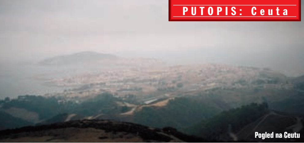
Pogled na Ceutu