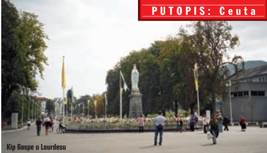
Kip Gospe u Lourdesu