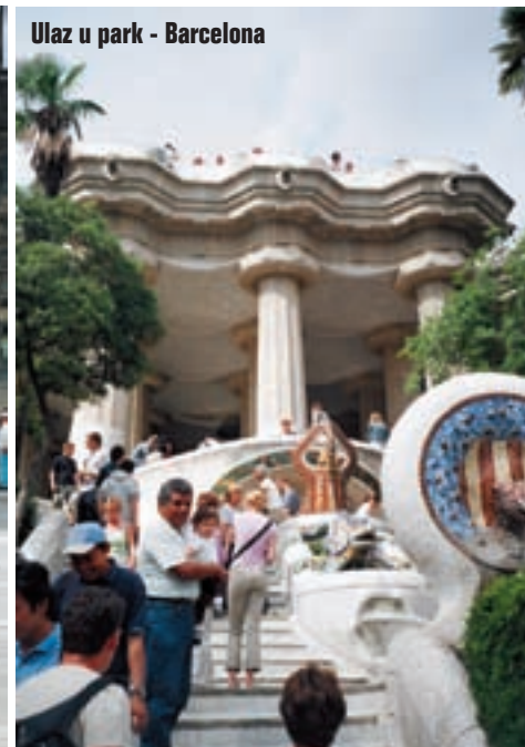
Ulaz u park - Barcelona