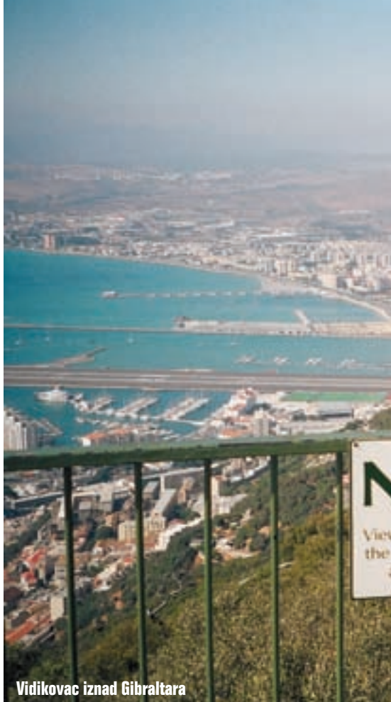
Vidikovac iznad Gibraltara