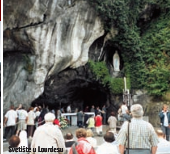
Svetište u Lourdesu

u samom centru mjesta, pa mi motocikl neće biti potreban za sutrašnji obilazak. Mrtav sam umoran! Skidam kišni kombinezon i pravac tuš, a onda, naravno, krevet.