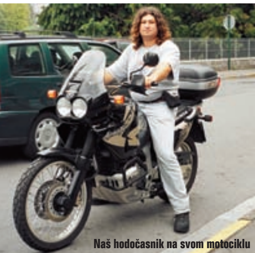
Naš hodočasnik na svom motociklu