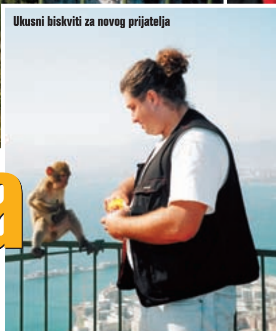
Ukusni biskviti za novog prijatelja