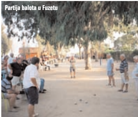
Partija balota u Fuzetu

puše tako jak vjetar, da sam primoran parkirati ispred nekog restorana i pričekati da vjetar oslabi. Koristim priliku, pa tu ručam. Nakon otprilike 3 sata vjetar je i dalje vrlo jak, ali meni se više ne čeka, pa nastavljam dalje prema Gibraltaru boreći se s vjetrom kao David s Goliјatom. Poslije dva sata borbe ulazim u Gibraltar koji, za one koji ne znaju, spada pod Veliku Britaniju. Taj prijelaz, kao što bi većina pomislila, uopće nije formalna stvar već granica kao i svaka druga. Španjolski policajac me propušta dok britanski traži upisanu vizu u putovnici, što ja, naravno, imam. Nije im jasno odakle sam došao. E sada, sigurno