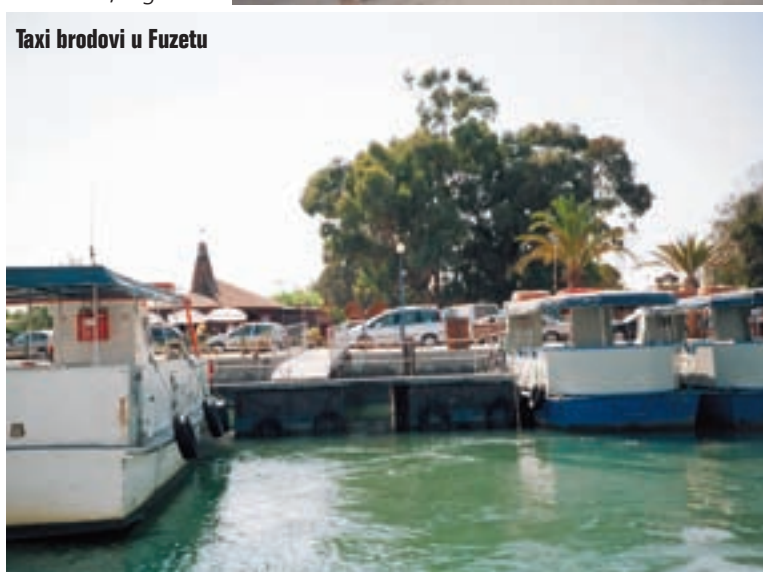
Taxi brodovi u Fuzetu