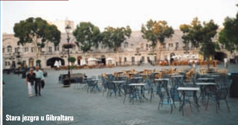
Stara jezgra u Gibraltaru