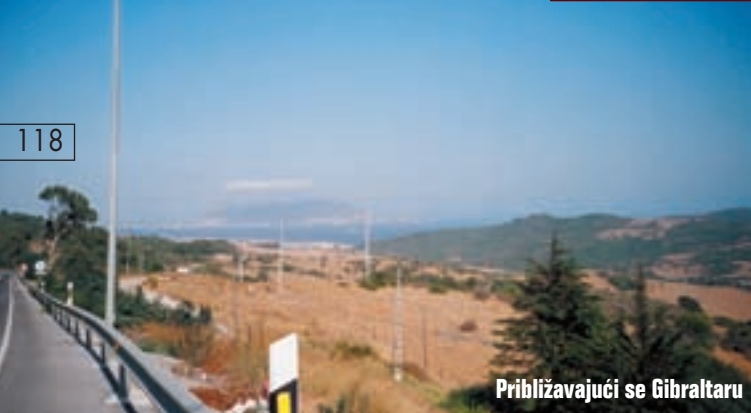
Približavajući se Gibraltaru