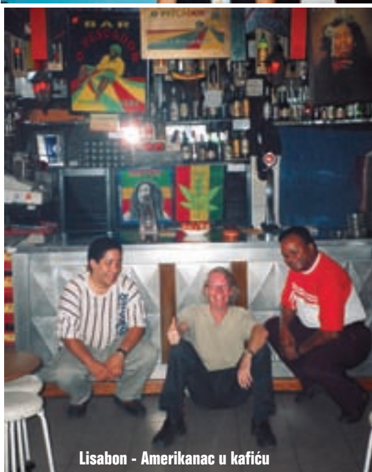
Lisabon - Amerikanac u kafiću