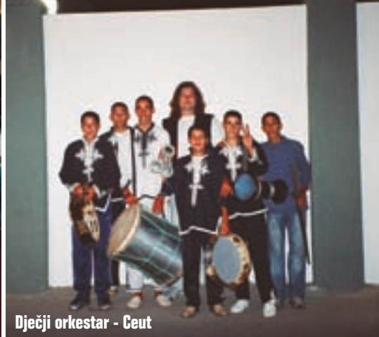
Dječji orkestar - Ceuta