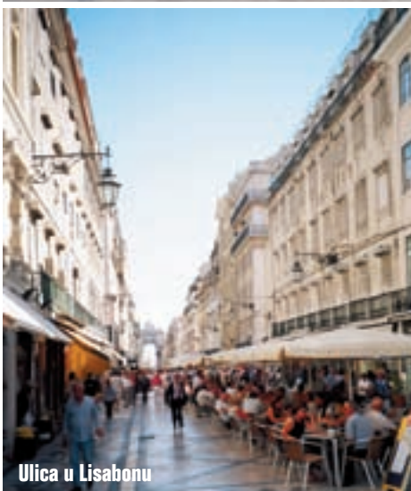
Ulica u Lisabonu