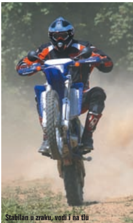
Stabilan u zraku, vodi i na tlu

Položaj za upravljačem kod ovog modela olakšava prebacivanje opterećenja na prednji kotač, pa je samim time olakšan ulazak