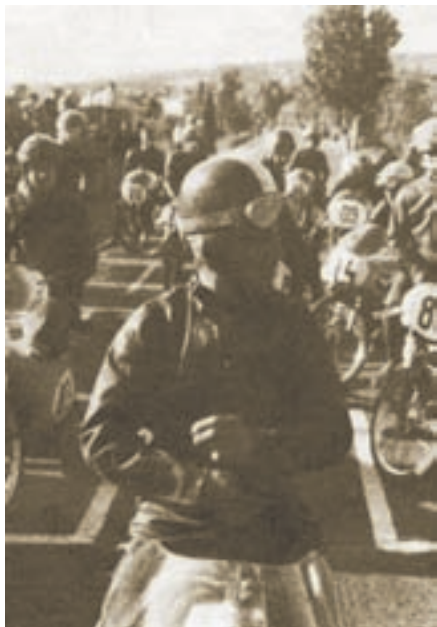
Start utrke u Zenici 1965. g. opet na Tomosu D-5. Zenica je bila pozivna utrka međunarodnog karaktera na kojoj su se u to doba našli i mnogobrojni inozemni vozači velikog kalibra

Dakle, negdje 1938. ili 1939. godine svoje prve natjecateljske "korake" započinje na Wandereru 125 ccm. U ono doba, dakle prije, ali i neposredno poslije II. svjetskog rata, posebno su popularna bile "speedway" utrke. One su se, baš kao i danas, vozile na "lešu": karbonskim ostacima ugljena sagorjelog u pećima tvornica, odnosno granulatima veličine lješnjaka posutim po stazi. U to su se vrijeme vozile i "dirt-track" utrke koje su se od spidveja