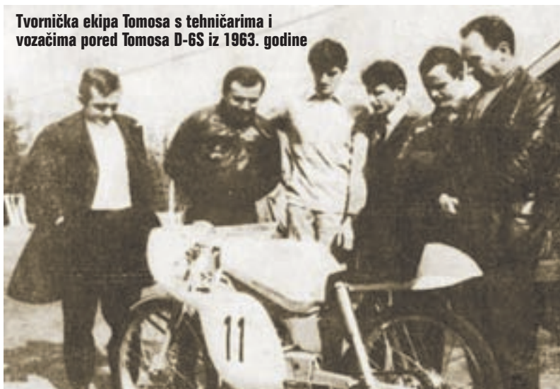
Tvornička ekipa Tomosa s tehničarima i vozačima pored Tomosa D-6S iz 1963. godine