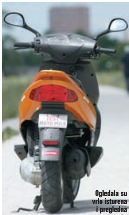
Ogledala su vrlo isturena i pregledna

nopravno nosite sa svima na bržim gradskim cestama, dok u gustom prometu, zbog njegove agilnosti i voznosti s lakoćom prolazite kroz prometne gužve i zastoje.