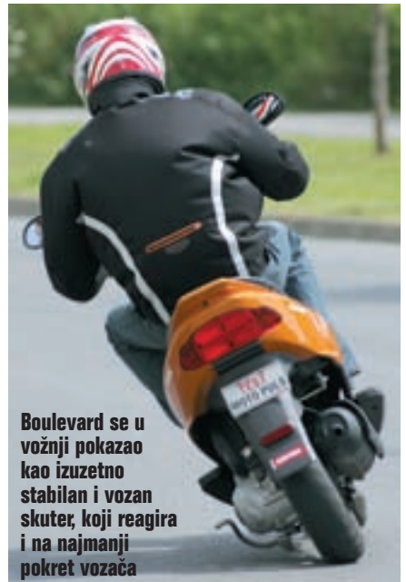
Boulevard se u vožnji pokazao kao izuzetno stabilan i vozan skuter, koji reagira i na najmanji pokret vozača

Za razliku od Skippera koji je opremljen kotačima od 12", Boulevard se vozi na lijepim aluminijskim naplaticima dimenzija 13" na koje su i sprijeda i straga montirani identični pneumatici širine 130/60. Zahvaljujući tim 13" kotačima i vrlo dobroj teleskopskoj vilici s promjerima cijevi 35 mm i s hodom 80 mm ovaj elegantni Katalonac je u vožnji izuzetno stabilan. U zavoje ulazi sigurno i lako, te je vrlo precizan u upravljanju i odgovara na najmanju reakciju vozača. Jedini problemi javljaju se pri prelasku preko većih neravnina na kolniku, gdje dolazi do narušavanja stabilnosti zbog kratkog hoda ovjesa i specifične konstrukcije okvira skutera, što je zapravo klasičan problem gotovo svih skutera ove klase. Zadnji ovjes riješen je uz pomoć monoamortizera koji ima mogućnost podešavanja tvrdoće opruge i ima hod identičan prednjoj vilici, a to je 80 mm. Kao što i samo ime govori, svoje pravo lice Boulevard pokazuje u gradskoj vožnji. Maksimalna brzina od 102 km/h omogućava vam da se rav-