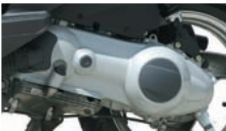
Pogonski agregat je vrlo dobro poznati Piaggiov Leader, koji u ovom slučaju razvija snagu od 10,4 KS pri 8 250 okr/min

Kočenje je sprijeda povjereno prednjem disku promjera 220 mm, dok straga to čini