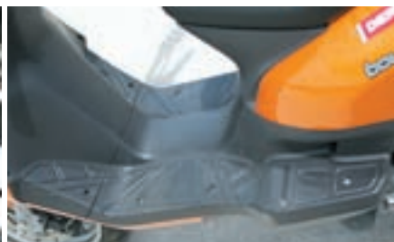
Prostrana podnica omogućava prijevoz stvari veće težine i većih dimenzija

Instrumenti se sastoje od voltmetra smještenog na krajnje lijevom dijelu, pokazivača brzine, pokazivača razine goriva u spremniku, te uobičajenih kontrolnih lampica među kojima je i ona koja upozorava na rad elek-