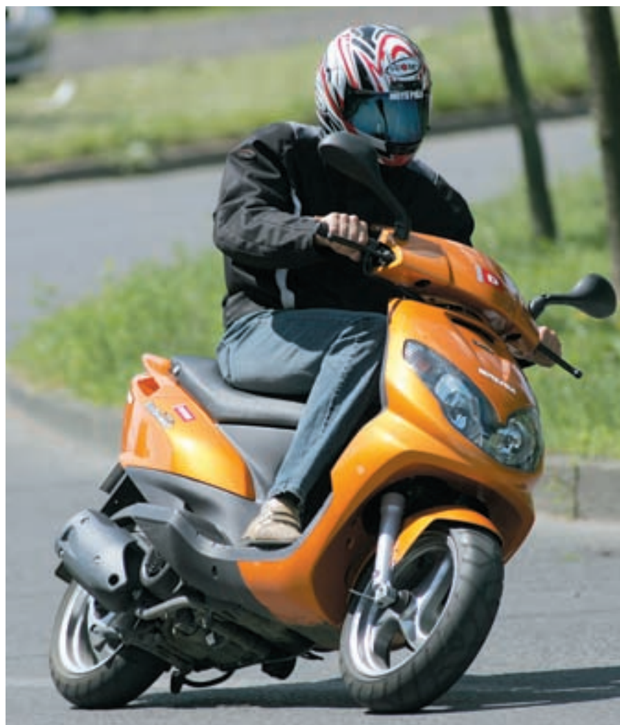
Atraktivno dizajnirano prednje svjetlo podsjeća na pogled mačke, a svoju funkciju odrađuje vrlo dobro

Unatoč svim navedenim nedostacima Derbi Boulevard 125 vrlo je praktičan i ekonomičan skuter, koji će cijenom od 21.690 kn svakako pronaći put do svoje klijentele jer provjereni pogonski agregat, štedljivost, lakoća upravljanja te elegantan dizajn čine Boulevard provjerenom formulom za uspjeh. ■