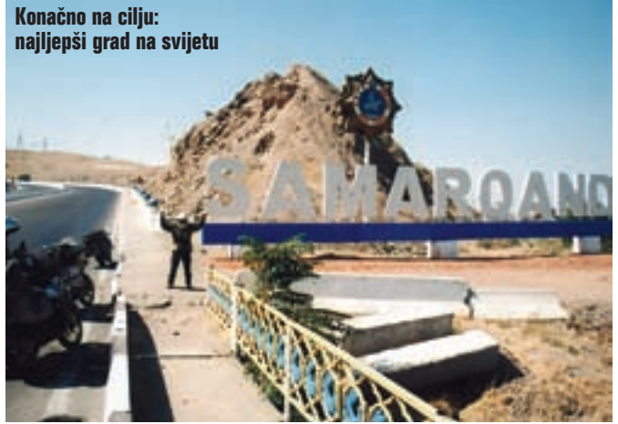
Konačno na cilju: najljepši grad na svijetu