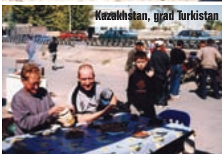
Kazahstan, grad Turkistan