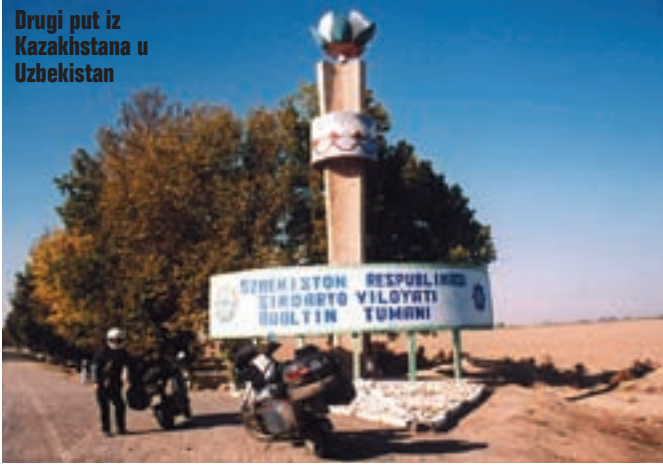
Drugi put iz Kazakhstana u Uzbekistan