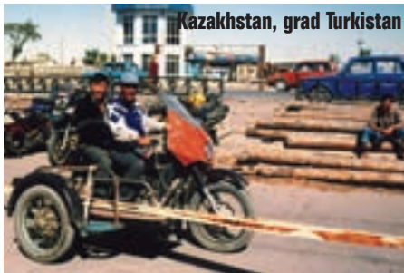
Kazahstan, grad Turkistan

Vozimo uzbekistanskim autoputom preko kojeg pretrčavaju pješaci i po kojem voze zaprežna vozila i evo nas uskoro opet