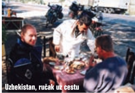
Uzbekistan, ručak uz cestu