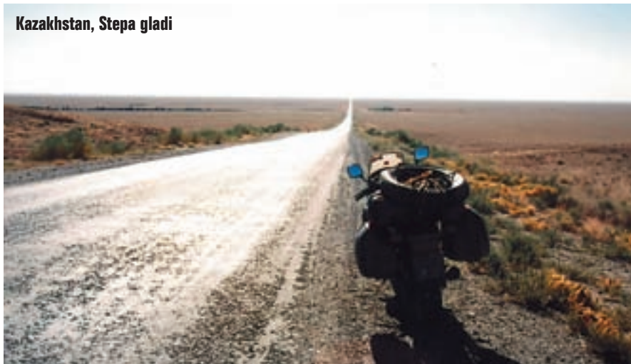
Kazakhstan, Stepa gladi