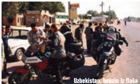
Uzbekistan, benzin iz flaša