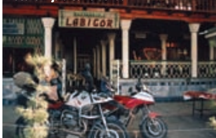
Naša birtija u Samarkandu

načno super, tako da nam to nije problem. To je pustinja Peski Sundukli. Kuhamo juhe, čajeve, a vodu za to nam je donio vojnik za ne baš malo novaca.