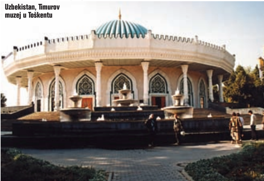
Uzbekistan, Timurov muzej u Toškentu