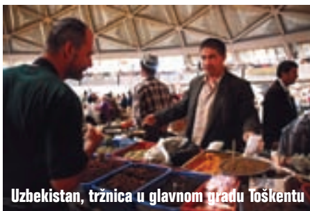
Uzbekistan, tržnica u glavnom gradu Toškentu

na granici: dio autoputa prolazi kroz Kazahstan, ali to prolazimo zaista bez problema - samo kontrola putovnica, slično kao kod prolaza Neuma kada putujemo za Dubrovnik. Vozimo kroz nepregledna polja pamuka, te promatramo žene kako beru pamuk. Zrakom lete komadići bijelih vlakana, a nešto kasnije smo opet u Uzbekistanu, u polupustinjском krajoliku. Ovdje vozimo rubnim dijelovima gorja Pamir nedaleko tadjikiske granice. U restoranu uz rub ceste uživamo u ovčetini i odličnom jogurtu. Kad smo prešli most preko rijeke Zerafšan, pred nama je ogroman natpis: SAMARQAND. To je i cilj našeg putovanja, to je prema mnogobrojnoj literaturi najljepši grad na svijetu. 6.700 kilometara smo od kuće. Jeftin smještaj u gradu ne posto-