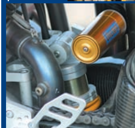
Sprijeda se ugrađuje Paioli upside-down vilica promjera 43 mm, dok se straga nalazi Ohlins-ov jednostruki amortizer

Prilikom samog pokretanja Piege nismo baš očarani njegovim zvukom. Očito da ovaj lijepi ispušni top ima i svojih nedostataka. Moramo priznati da se dvo cilindrična Honda i Ducati moćnije glasaju. No, to i nije toliko važno. Ali ono što nas pomalo smeta je glomazan prednji kraj s vrlo otvorenim ručkama. On u vožnji nije nimalo okretan, ali je s druge strane vrlo sta-