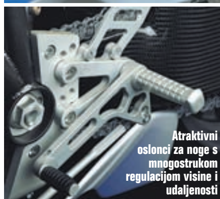
Atraktivni oslonci za noge s mnogostrukom regulacijom visine i udaljenosti