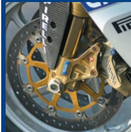
Dvostruki plivajući diskovi promjera 320 mm i Brembo četveroklipna kočiona klijesta sa četiri zasebne pločice