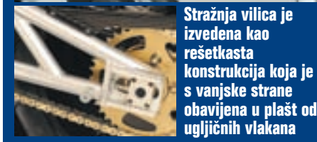
Stražnja vilica je izvedena kao rešetkasta konstrukcija koja je s vanjske strane obavijena u plašt od ugljičnih vlakana