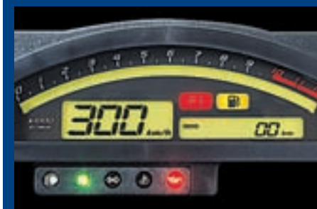
Instrumenti su u potpunosti preuzeti sa Hondinog modela SP-01