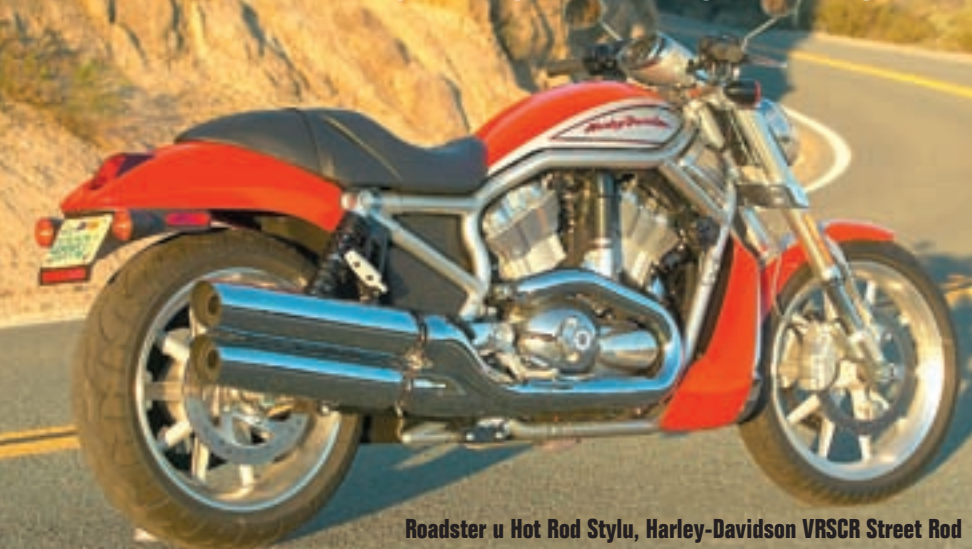
Roadster u Hot Rod Stylu, Harley-Davidson VRSCR Street Rod

Aposlutna novost dolazi nam iz tvornice Harley Davidson: Street Rod. Iako nalikuje modelu V-Rod i s njime dijeli većinu elemenata, novi model iz Milwaukeea odlikuje se boljim performansama, agresivnijom ergonomijom i agilnijom ciklistikom. Upravljač je uži, niži i postavljen više prema naprijed, oslonci za noge nalaze se točno ispod sjedala, a kut prednje vilice i međuosovinski razmak su smanjeni. Ekskluzivno za Moto Puls u SAD ga je testirala Lixi Laufer, urednica Reise Motorrada