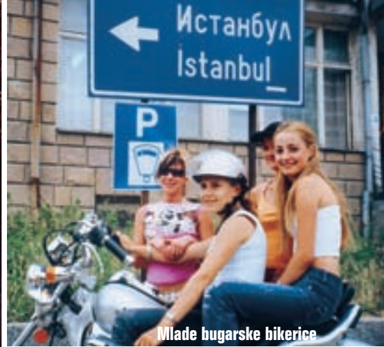
Mlade bugarske bikerice