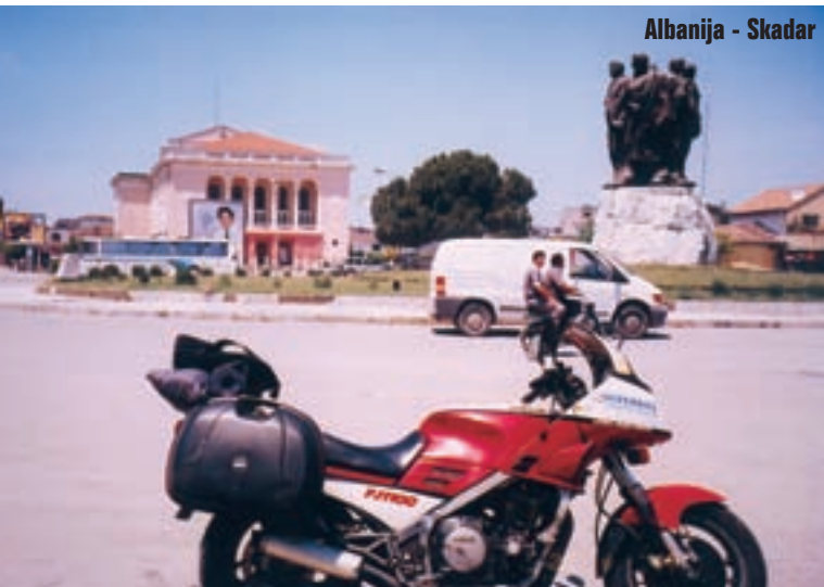
Albanija - Skadar