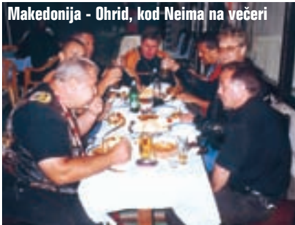
Makedonija - Ohrid, kod Neima na večeri

zeru. Iza Struge prolazim kroz Kališta, te se kraće zadržavam u Radoždi, na samoj albanskoj granici. Selo je tipično makedonsko, Ohridsko jezero se prelijeva u suncu, pa je šteta to ne zabilježiti foto-aparatom.