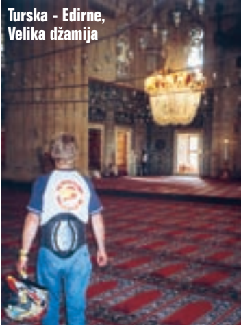
Turska - Edirne, Velika džamija