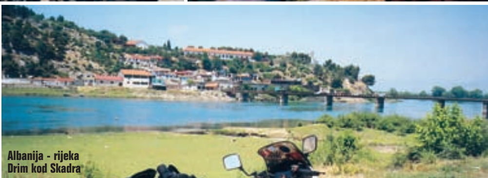
Albanija - rijeka Drim kod Skadra

metara, sve do Broda na Drini, bog kao da je zaboravio na ove krajeve. Nakon što sam granicu prešao drvenim mostom, cesta postaje uska i poluasfaltirana, tj. s rastrganim starim asfaltom, pa se osjećam kao nekada u Albaniji. Između Broda na Drini i Sarajeva vozim po dobroj cesti kanjonom rijeke Bistrice, a