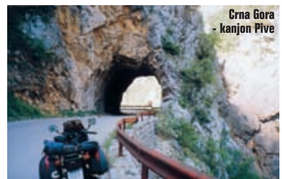
Crna Gora - kanjon Pive

tovanje koje je trajalo nepunih tjedan dana u ukupnoj dužini od 3.650 km ostat će mi u lijepom sjećanju. Ostatak moje ekipe je također kroz Albaniju prešao u Crnu Goru, te kroz Crnogorsko primorje do Makarske rivijere. Vrag mi nije dao mira, pa sam se nakon dva dana našao sa njima u Baškoj vodi... ■