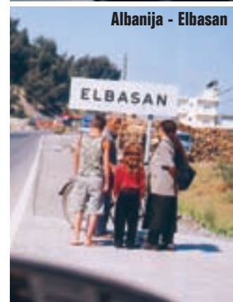
Albanija - Elbasan