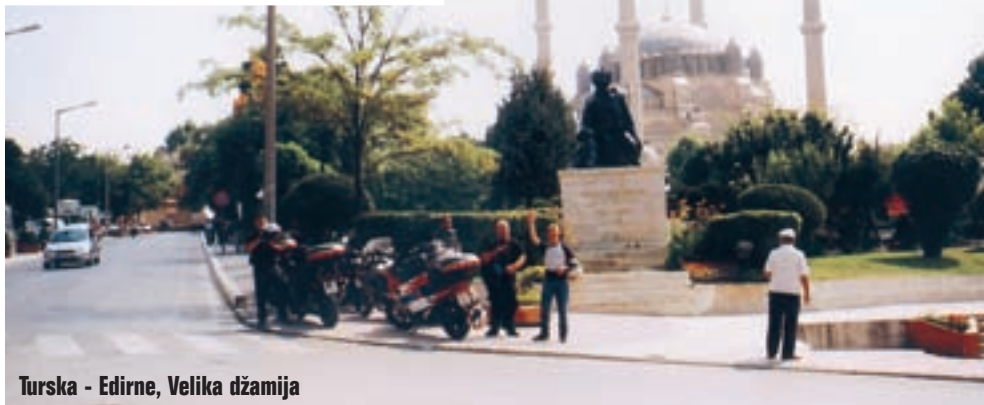
Turska - Edirne, Velika džamija