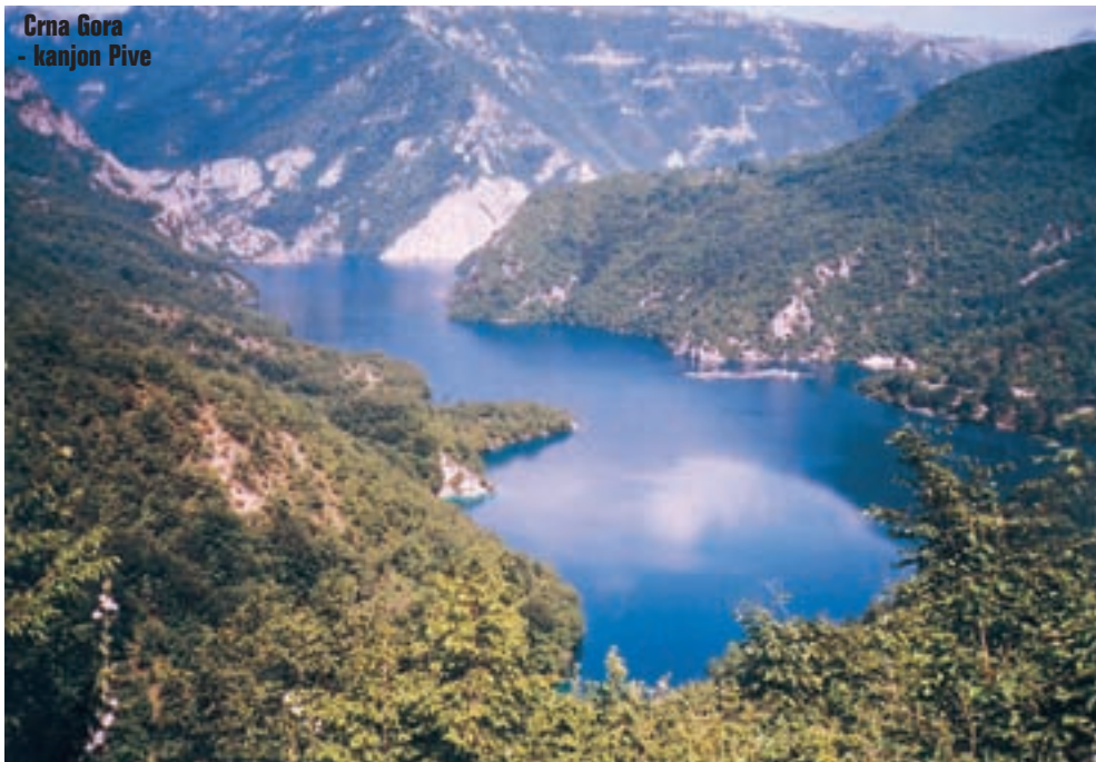
Crna Gora - kanjon Pive

među planina, a onda se kod mjesta Plužine spušta do same obale uz koju su uklesani mnogobrojni tuneli. Vrijeme je prekrasno, pa je vožnja kanjonom Pive više nego doživljaj. I tako do Šćepan Polja, gdje je granica s BiH. Iza granice se Piva sastaje s Tarom i zajedno čine Drinu. A nekih tridesetak kilo-