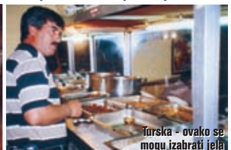
Turska - ovako se mogu izabrati jela