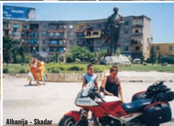
Albanija - Skadar