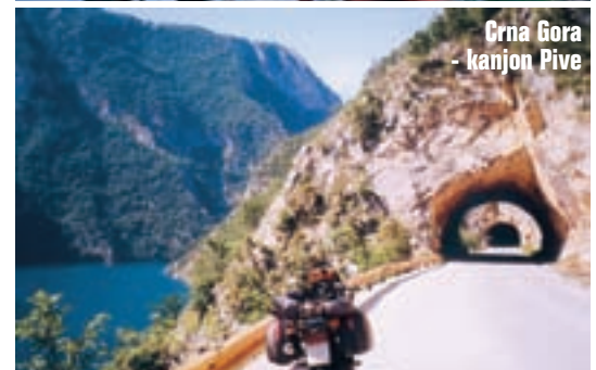
Crna Gora - kanjon Pive