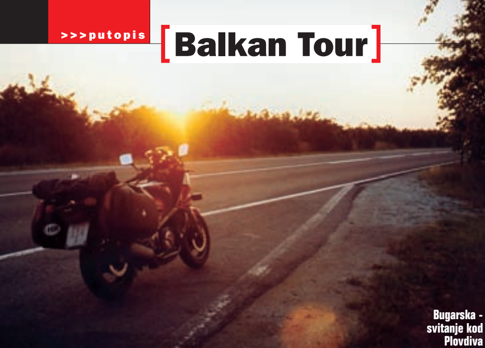
Bugarska - svitanje kod Plovdiva