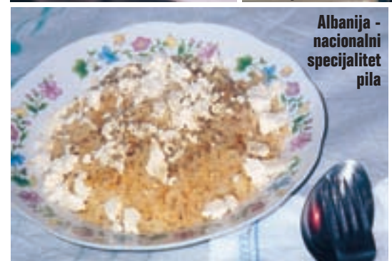
Albanija - nacionalni specijalitet pila