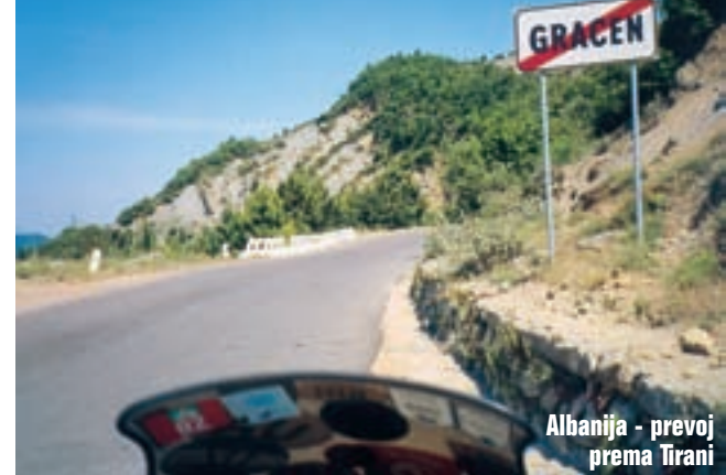
Albanija - prevoj prema Tirani