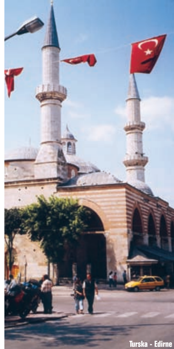
Turska - Edirne