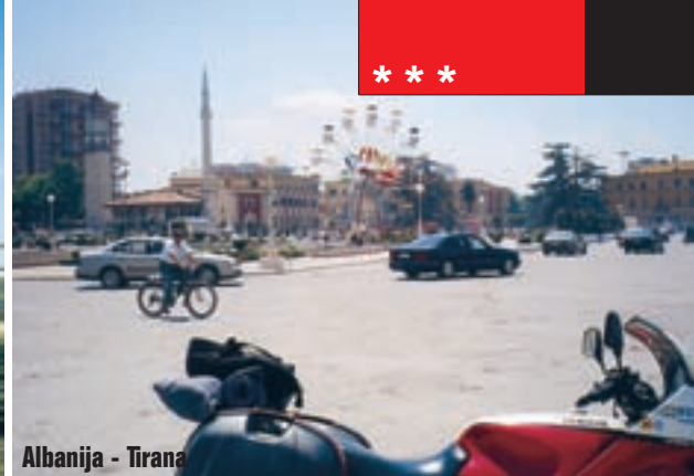
Albanija - Tirana