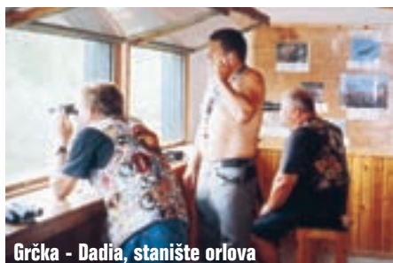
Grčka - Dadia, stanište orlova

ni ovdje nisu vladale uobičajene paklene vrućine, tako da je bilo ugodno voziti uz obalu. Neprekidno smo sretili skupine motorista na povratku s Panhellenica. Današnji cilj je grad Kavala, kamo smo stigli predvečer. Smjestili smo se u kamp, a neki u bungalove i taman je još bilo vremena da se okupamo za dana. Kavala je prekrasan grad koji nas podsjeća na Split. Sljedeći dan uspinjemo se na tvrđavu s koje puca pogled sve do otoka Thassosa. Put nas dalje vodi uz jezera Volvi i Koronia do Thessalonikia, kojeg obilazimo, pa dalje u planine sjeverne Grčke. Zavojnita cesta vodi nas do grada Edessa. Kako smo manje-više svi umorni od napora nekoliko posljednjih dana, u Edessi se zaustavljamo da nešto popijemo. Rano poslijepodne je, a grad kao da je zamro: nikoga nema na ulicama. Posljedica je to vrućine, valjda su se svi zatvorili u kuće. Brdovitim predjelima nastavljamo prema makedonskoj granici. Uskoro smo u Bitoli i skrećemo u centar grada. Svrtaćemo u kafić na dugo očekivano skopsko pivo. Kroz pokrajinu Pelagonija dalje vozimo preko Plačenske planine prema Ohri-