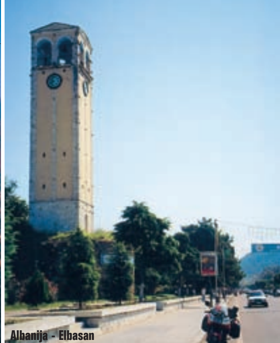
Albanija - Elbasan