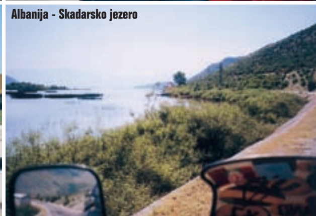
Albanija - Skadarsko jezero