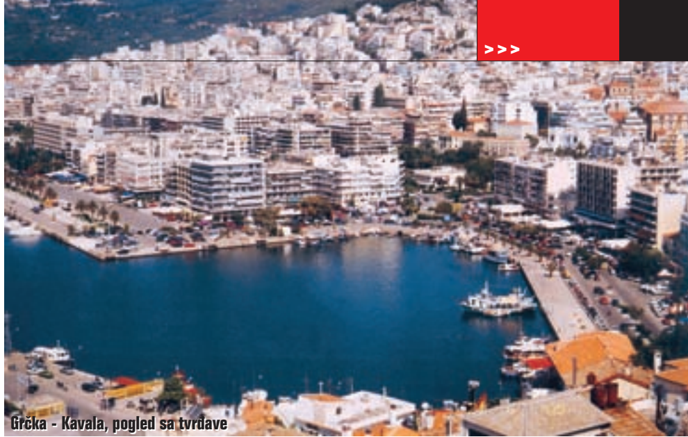
Grčka - Kavala, pogled sa tvrđave