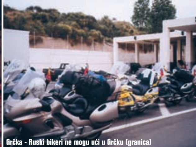
Grčka - Ruski bikeri ne mogu ući u Grčku (granica)