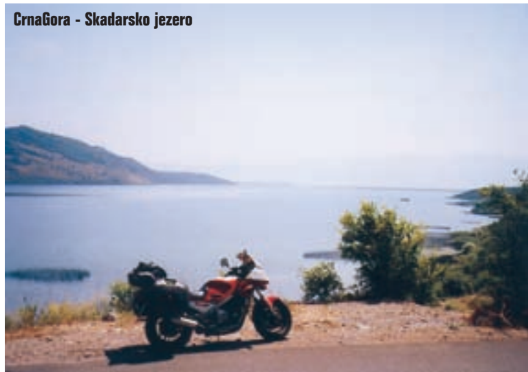
CrnaGora - Skadarsko jezero

trg koji smo nekad gledali na televiziji, a bio je pun bicikala. Sada je pun automobila. Izaći iz Tirane još je problematičnije nego je bilo ući, pa se probijam između mnogobrojnih starih, ali i novih Mercedes, koji su ovdje u Albaniji najčešće marke. Nakon Tirane izlazim na cestu koja povezuje sjever i jug zemlje, kojom sam vozio prije pet godina. Tada je bila prepuna rupa, tako da smo se kretali u prvoj ili drugoj brzini. Sada tom istom cestom konstantno vozim 160 km/h (osim u selima), a na trenutak sam povukao i do 230 km/h. Da mi je to netko pričao prije pet godina! Tako sam stigao u Skadar, napravio nekoliko fotki, popio sok, pogledao spomenike nekim njihovim junacima koji su obavezno postavljeni nasred velikih raskrižja i krenuo na zadnji dio puta, prema crnogorskoj granici. Tu je cesta nešto lošija, ali prohodna. Tako sam djeci, koja su se igrala nasred ceste, potrubio da se maknu, a za uzvrat sam dobio kamen u rebra. Stigao sam na obalu Skadarskog jezera, a tu je i granica, koju sam prošao skoro isto tako brzo kao, recimo, da sam na Šentilju. Crnogorski dio Skadarskog jezera je park prirode i vrlo je lijep, a jako me podsjeća na Kopački rit, isto tako je močvara kao i kod nas. Nemam previše vremena za razgledavanje jer navečer moram biti doma, a već je poslijepodne. Kroz Tuzi, gdje pretežno žive Albanci, uskoro sam u glavnom gradu Podgorici, koju obilazim, pa zatim pravac