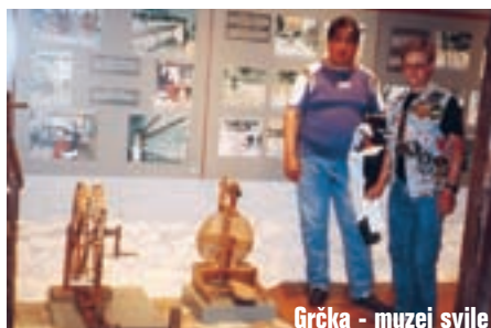
Grčka - muzej svile