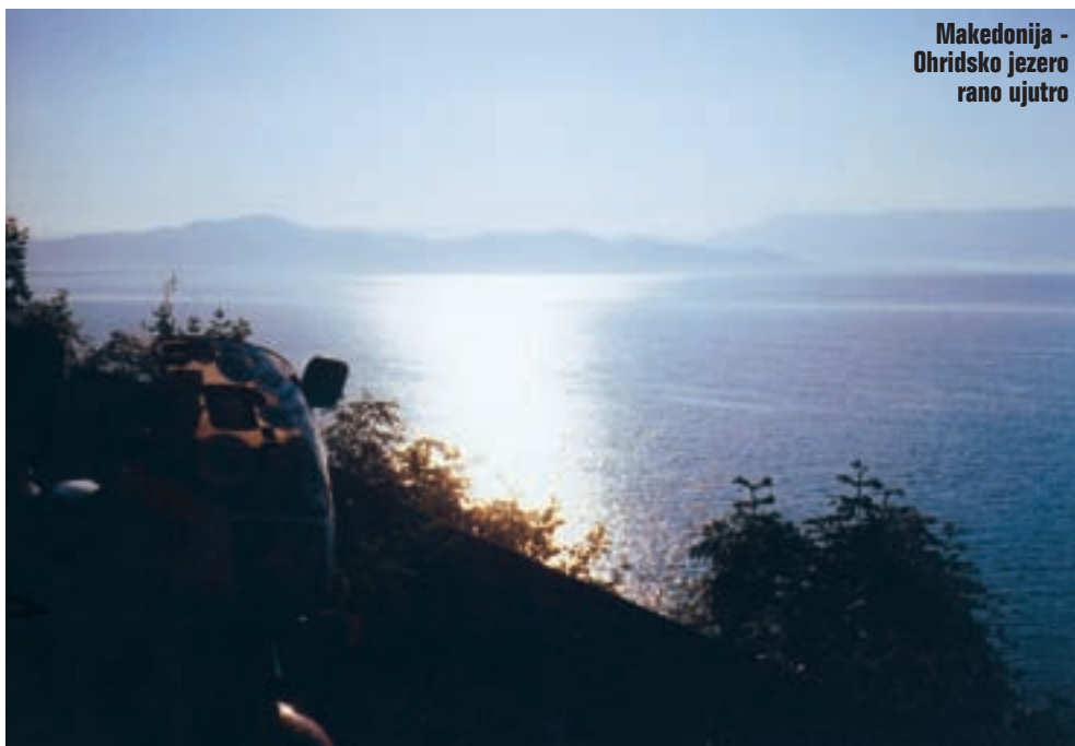
Makedonija - Radožda na Ohridskom jezeru