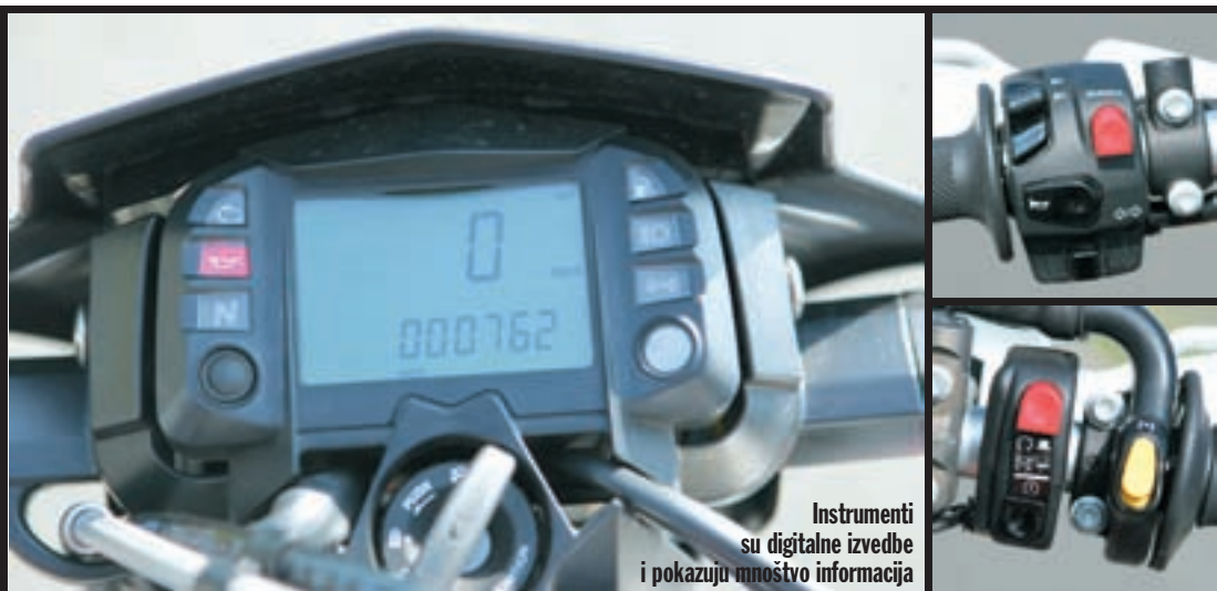
Instrumenti su digitalne izvedbe i pokazuju mnoštvo informacija

- cijena, komfor, nepraktična stojna nožica, izostanak bravice na čepu spremnika goriva