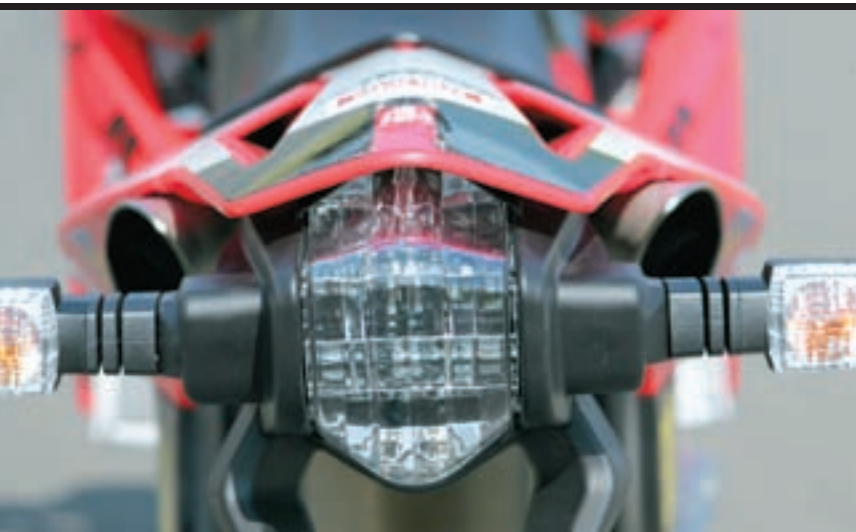
Stražnje svjetlo je poznato sa modela Tuono, a pokazivači pravca su isti kao na modelu Pegaso. Atraktivan i inovativan ispušni sustav sa dva mala prigušivača zvuka