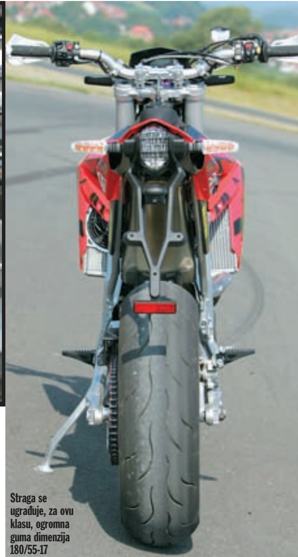
Straga se ugrađuje, za ovu klasu, ogromna guma dimenzija 180/55-17