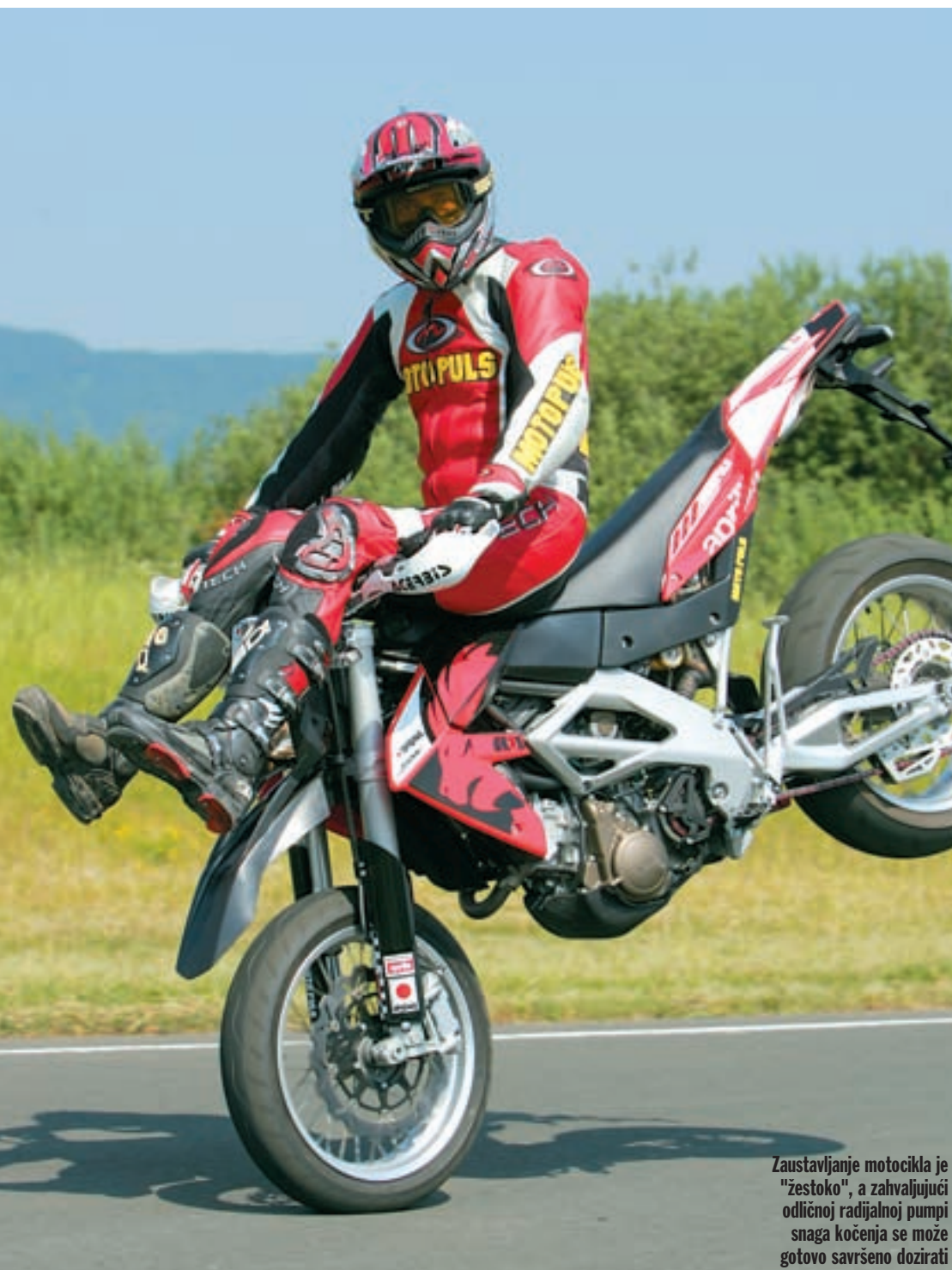
Zaustavljanje motocikla je "žestoko", a zahvaljujući odličnoj radijalnoj pumpi snaga kočenja se može gotovo savršeno dozirati

prilikom izvođenja različitih manevara. Uvjetima sportske vožnje prilagođen je i ovjes, koji se sastoji od prednje potpuno podesive upside-down vilice s cijevima promjera 48 mm i stražnjeg jednostrukog amortizera, također podesivog po svim parametrima, koji je sa stražnjom aluminijskom vilicom spojen preko sustava progresivnog polužlja.