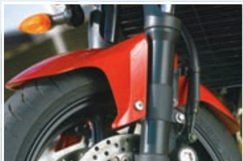
Novi čete FZ6 od njegovog prethodnika najlakše razlikovati po agresivnijem prednjem blatobranu