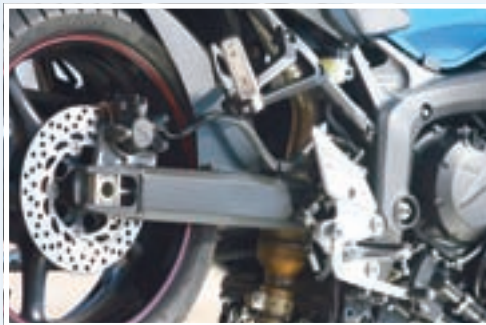
Jedna od novosti na S2 modelu je nova stražnja vilica drugačijeg presjeka