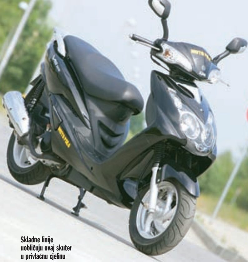
Skladne linije uobličuju ovaj skuter u privlačnu cjelinu