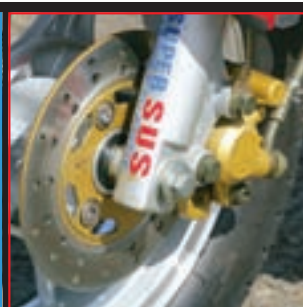
Prednji kočioni disk identičan je na oba modela