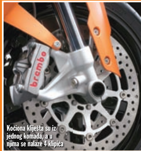
Kočiona kliješta su iz jednog komada, a u njima se nalaze 4 klipića

U duhu "Ready to race" KTM deklarira težinu sa svim tekućinama uključujući i gorivo ispod 200 kg, što je hvalevrijedan podatak. No, suhoparni