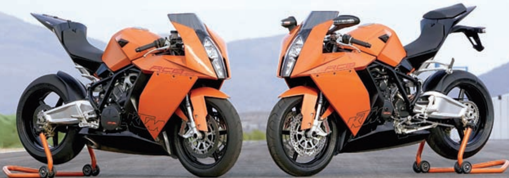
Na slici lijevo je model spreman za pistu kao jednosjed, bez retrovizora, pokazivača smjera i nosača tablice, dok je desno homologiran model za cestovnu uporabu. Transformacija iz jednog u drugi vrlo je jednostavna i traje svega nekoliko minuta

A ruku na srce i načekali smo se još od 2003. godine, kada je predstavljen prvi prototip RC8 na dalekom Tokyo Motor Showu. Duže iščekivanje od prototipa do finalnog proizvoda priredio je jedino Suzukijev B-King (6 godina), koji umalo da nije zauvijek ostao na nivou makete. No, austrijski tehničari oduvijek su tvrdili da će RC8 kad-tad ugledati serijsku proizvodnju, te da će to biti čim budu završena brojna testiranja i pripreme, kako bi ovaj Superbike već u startu bio lansiran na sam vrh ponude.