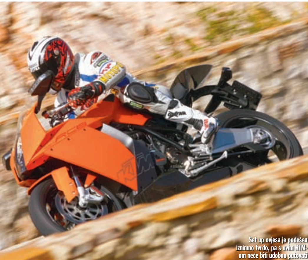
Set up ovjesa je podešen iznimno tvrdo, pa s ovim KTM-om neće biti udobno putovati