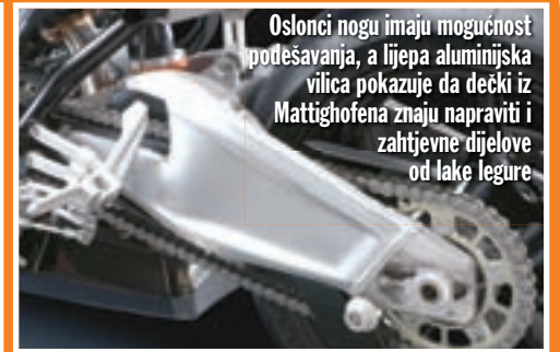
Oslonci nogu imaju mogućnost podešavanja, a lijepa aluminijska vilica pokazuje da dečki iz Mattighofena znaju napraviti i zahtjevne dijelove od lake legure

▼ Čistoća linija okvira i novi sustav zavarivanja čine ovaj element filigranskim radom i pokazuje kako se i na ovako robusnom elementu može stalno usavršavati. KTM je stalnim poboljšavanjem okvira anulirao prednost aluminijske izvedbe