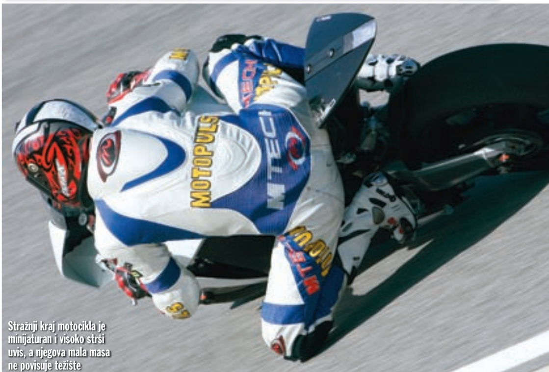
Stražnji kraj motocikla je minijaturan i visoko strši uvis, a njegova mala masa ne povisuje težiste