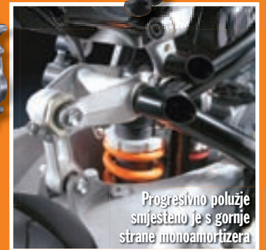
Progressivno polužje smješteno je s gornje strane monoamortizera