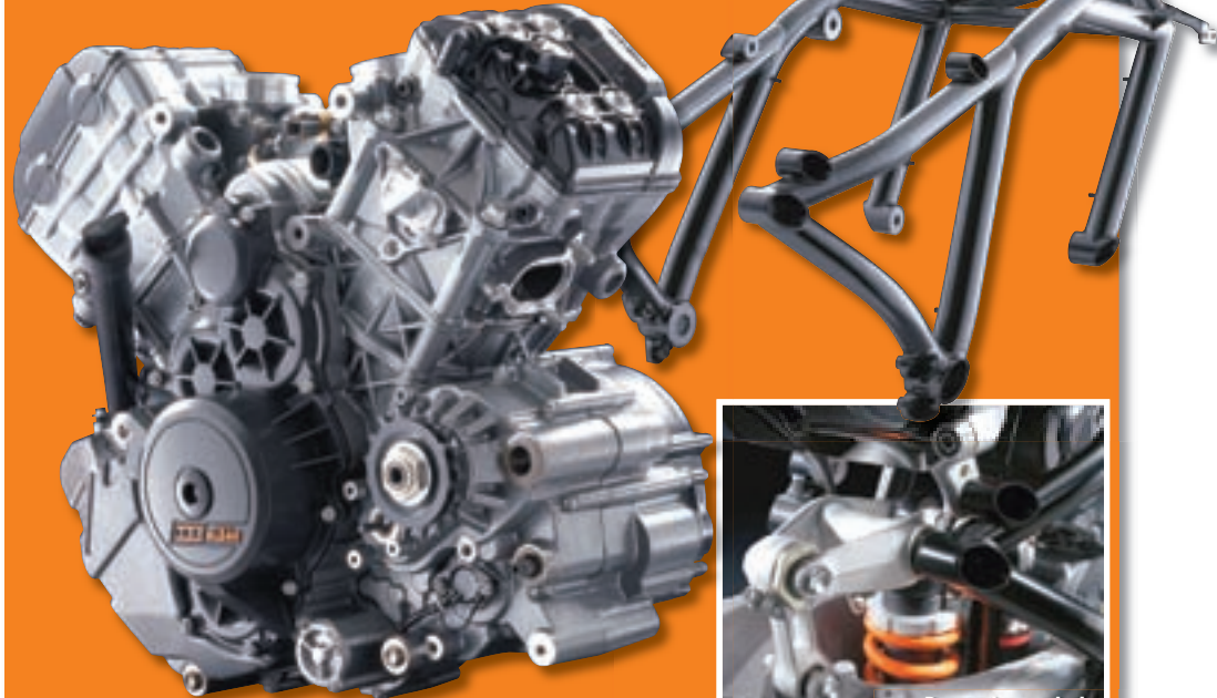
▲ V2 Agregat je vrlo kompaktnih dimenzija i teži svega 64 kg, te je sa kutom cilindra od 75° je točno na pola puta između Aprilinog V2 pod 60 stupnjeva i Ducatijevog od 90 stupnjeva

▼ Čistoća linija okvira i novi sustav zavarivanja čine ovaj element filigranskim radom i pokazuje kako se i na ovako robusnom elementu može stalno usavršavati. KTM je stalnim poboljšavanjem okvira anulirao prednost aluminijske izvedbe