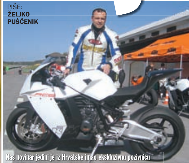
PIŠE: ŽELJKO PUŠČENIK

Nas novinar jedini je iz Hrvatske imao ekskluzivnu pozivnicu