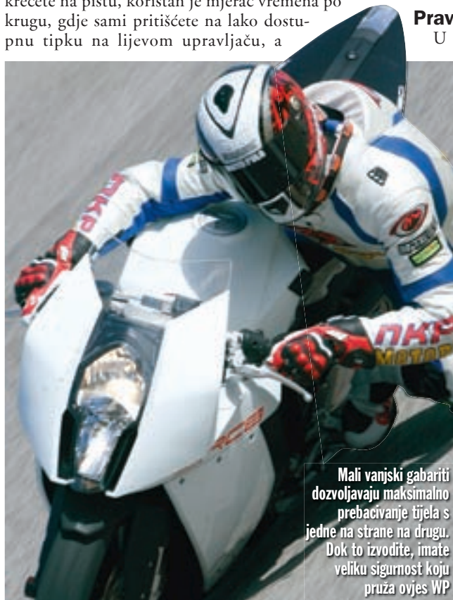
Mali vanjski gabariti dozvoljavaju maksimalno prebacivanje tijela s jedne na strane na drugu. Dok to izvodite, imate veliku sigurnost koju pruža ovjes WP

Da biste mogli pratiti instrumente, koji su toliko sadržajni da su količinom informacija postali nepregledni jer uvijek tražimo informaciju u moru ostalih, potrebno je privikavanje. Dakle, prije kretanja dobro je proučiti smještaj podataka i gdje se nalaze, kako vam to kasnije ne bi skretalo pozornost s ceste za vrijeme vožnje, jer brojke su male i gotovo sve iste veličine. Ako krećete na pistu, koristan je mjerač vremena po krugu, gdje sami pritišćete na lako dostupnu tipku na lijevom upravljaču, a