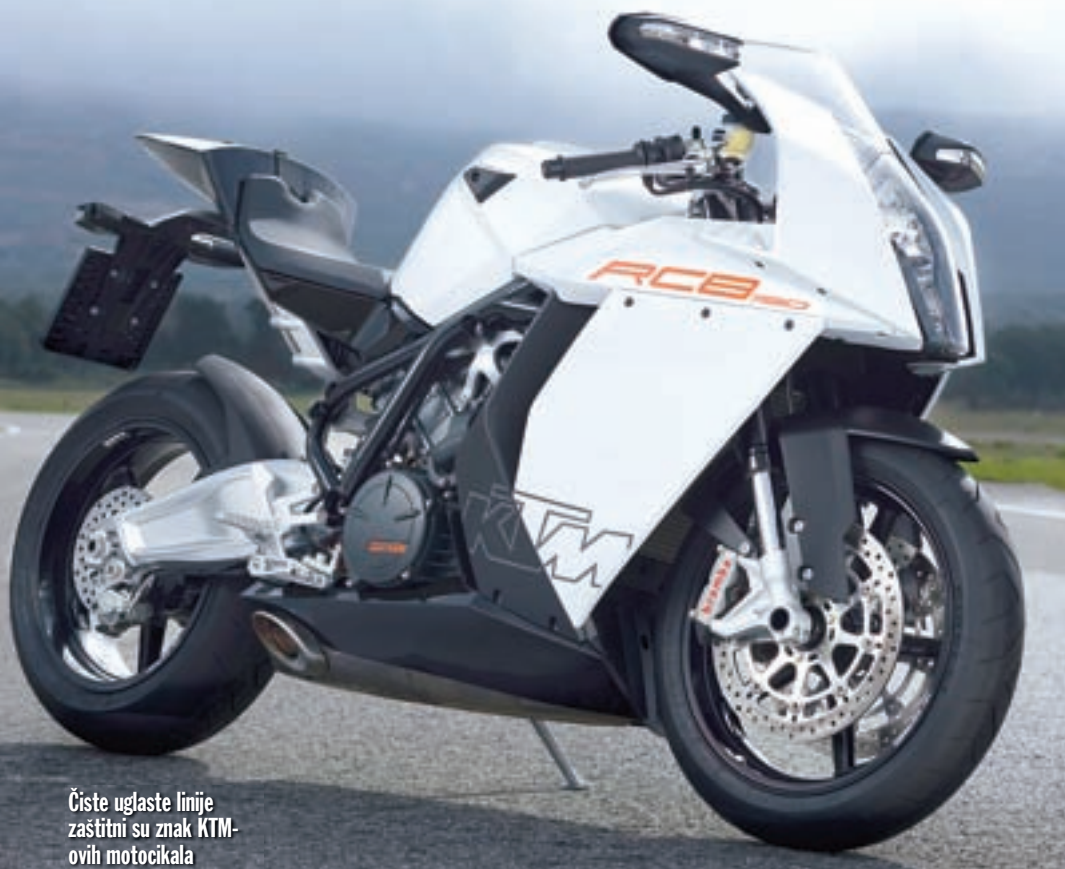
Čiste uglaste linije zaštitni su znak KTM-ovih motocikala

podaci su jedno, a djelovanje u praksi nešto sasvim drugo pa smo se uputili u toplije krajeve, na sam jug Španjolske, gdje se smjestila pista Ascari u mjestu Ronda, 50-tak kilometara od obale mora, kako bismo provjerili njegove dinamičke mogućnosti. Prekrasna pista Ascari i topao suncem okupan dan poslužili su nam u našem naumu.