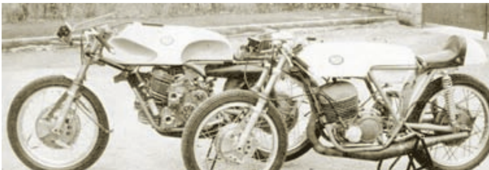
Braća Francesco i Walter Villa bili su uspješni konstruktori dvotaktnih natjecateljskih motora od 125 i 250 ccm. Na slici vidimo monocilindrični 250 s roto diskom i četverocilindrični motor iste zapremine