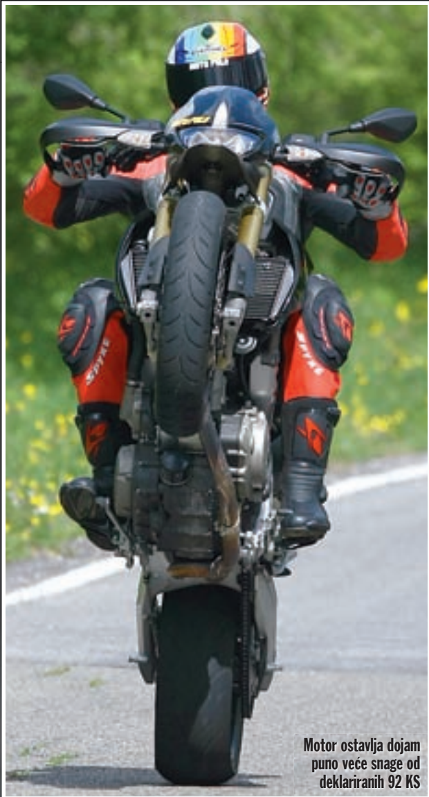
Motor ostavlja dojam puno veće snage od deklariranih 92 KS

Bez obzira u kojem se režimu nalazili, agregat uvijek radi izuzetno mirno i ugladeno i lišen je gotovo svih vibracija inače svojstvenih klasičnim dvocilindrašima. U stvari, da nema karakterističnog zvuka skoro da biste pomislili da se ovdje radi o nekoj potpuno drugačijoj koncepciji agregata