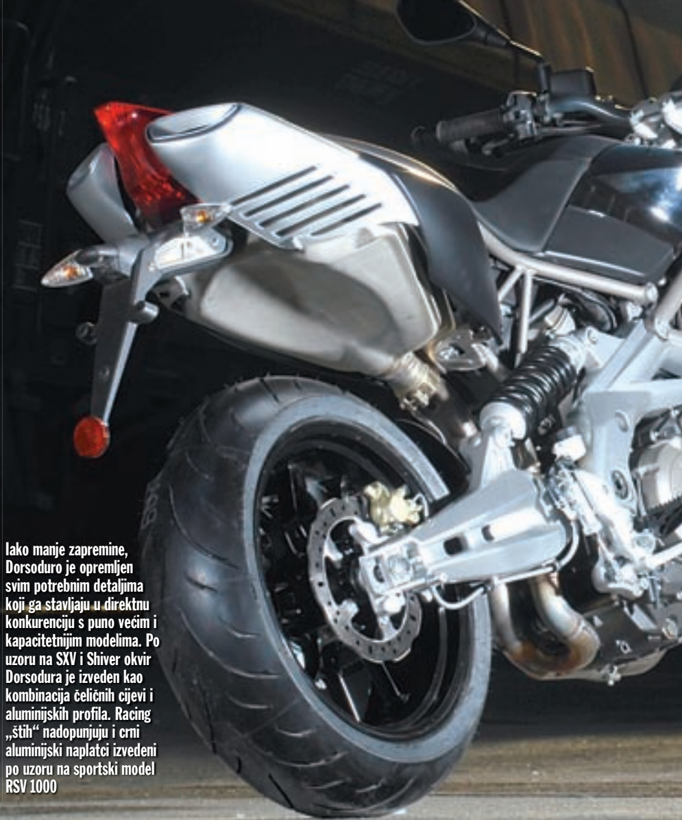
Iako manje zapremine, Dorsoduro je opremljen svim potrebnim detaljima koji ga stavljaju u direktnu konkurenciju s puno većim i kapacitetnijim modelima. Po uzoru na SXV i Shiver okvir Dorsodura je izveden kao kombinacija čeličnih cijevi i aluminijevih profila. Racing „štih“ nadopunjuju i crni aluminijevski naplatci izvedeni po uzoru na sportski model RSV 1000