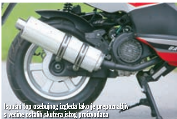
Ispušni top osebujnog izgleda lako je prepoznatljiv s većine ostalih skutera istog proizvođača