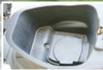
▲ Prostor ispod sjedala nije osobito velik, no u njega ćete ipak uspjeti smjestiti najosnovnije potrepštine

za koji je potrebno izdvojiti tako malo novca. Za samo 6.989,25 kn ili čak samo 6.500 kn ukoliko ste spremni izdvojiti cjelokupni iznos u gotovini, dobivate jedno konkretno malo vozilo koje će vam uvelike olakšati život u ljetnim mjesecima. A nakon svega, nije li upravo to glavna namjena i kvaliteta koju svi traže od skutera? ■