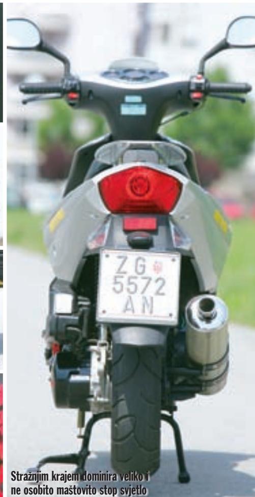
Iako ga pokreće agregat od 125 ccm, po gabaritima je BT 125 T više nalik skuterima od 50 ccm