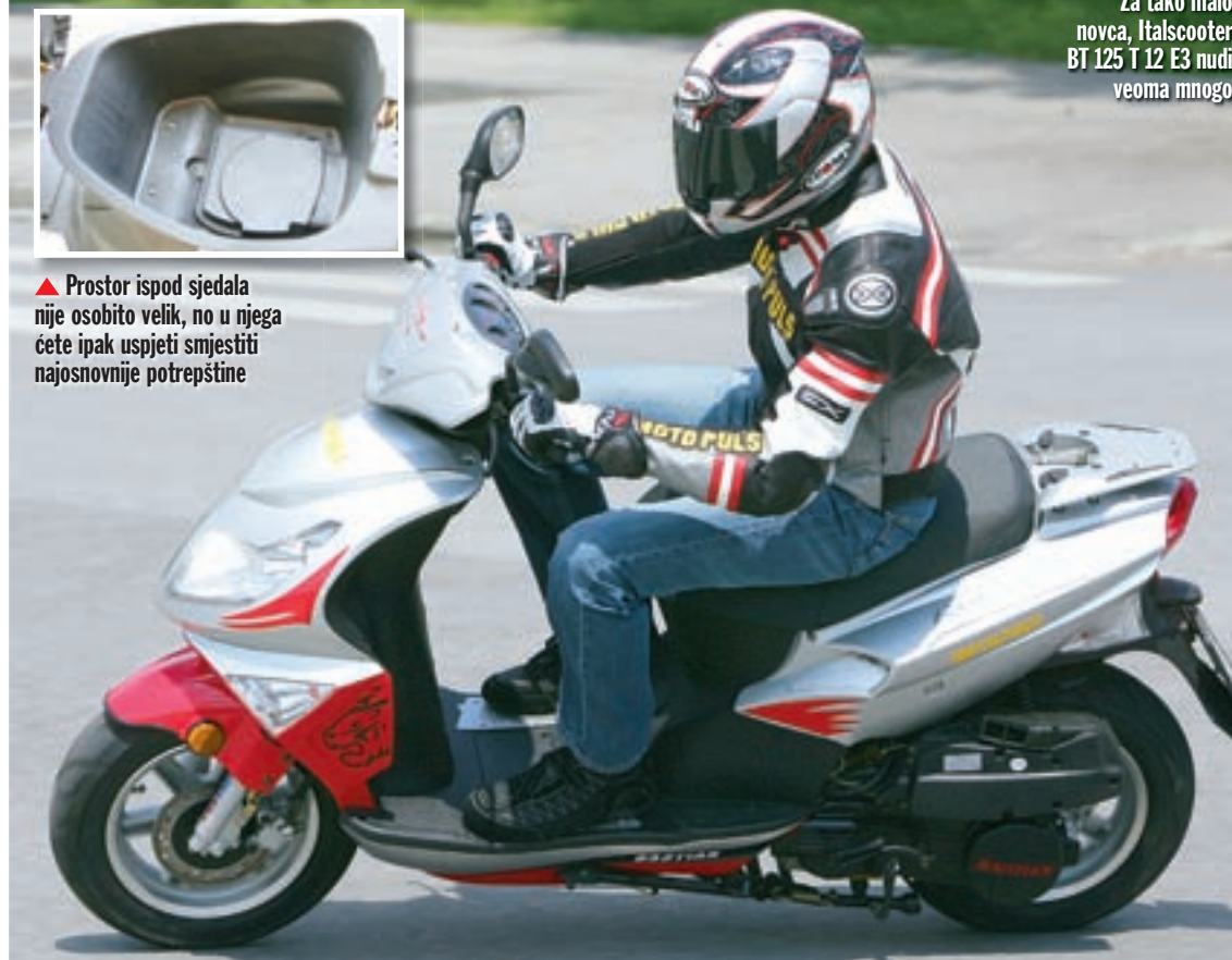
Za tako malo novca, Italscooter BT 125 T 12 E3 nudi veoma mnogo