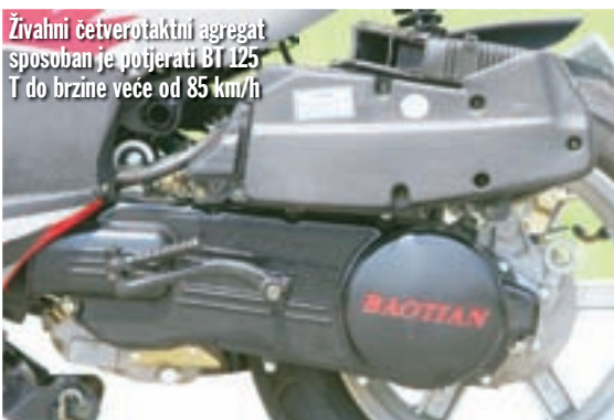
Živahni četverotaktni agregat sposoban je potjerati BT 125 T do brzine veće od 85 km/h