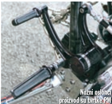
Nožni oslonci proizvod su tvrtke PM