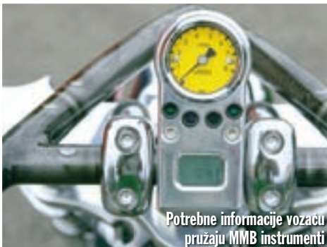
Potrebne informacije vozaču pružaju MMB instrumenti

Kako unikatne motocikle čine detalji, moramo vam skrenuti pozornost na "spicu" načinjenu od lanca