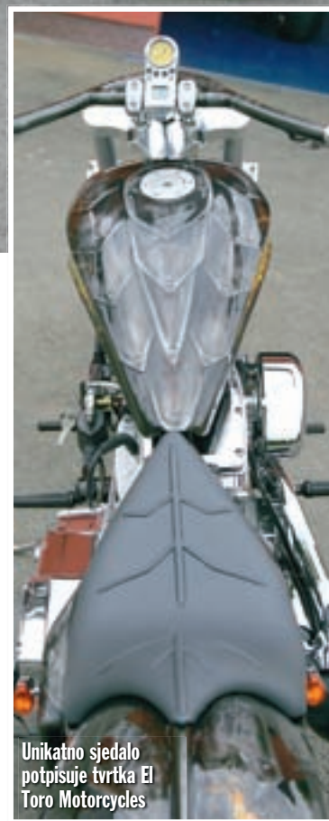
Unikatno sjedalo potpisuje tvrtka El Toro Motorcycles

to doradena, dok je straga Softail ovjes uz sakrivene amortizere Progressive Suspension. Međuosovinski razmak iznosi okruglih 2.000 mm. Ova grdosija počiva na njemačkim alumi-nijskim naplatcima tvrtke Riek, dok su Avon gume dimenzija 130/70-18 odnosno 250/70-18. O agregatu možemo reći puno toga, a kako Amerikanci, koji ga proizvode, svemu vole davati imena, možemo reći da je riječ o Supersidewinderu 113. Broj u oznaci govori koliko kubnih inča zapremine je u pitanju, a u metričkim jedinicama to iznosi 1.850 kubičnih centimetara. Kombinacija ovakve zapremine, S&S 600 bregaste osovi-