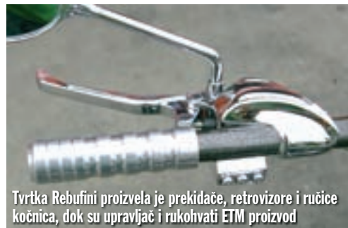
Tvrtka Rebufini proizvela je prekidače, retrovizore i ručice kočnica, dok su upravljač i rukohvati ETM proizvod