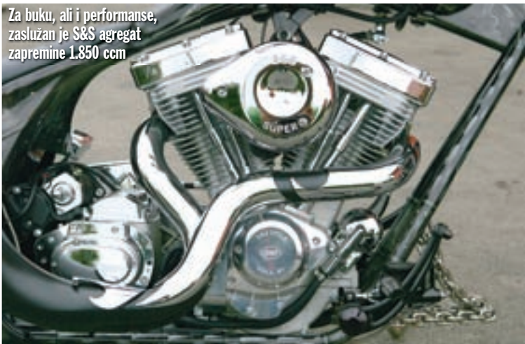
Za buku, ali i performanse, zaslužan je S&S agregat zapremine 1.850 ccm

katnih dijelova koji su nastali u pogonima El Toro Motorcycles, a jedan od njih je i upravljač, na kojem se nalaze Rebufini prekidači i ručice kočnica, dok su kontrolni instrumenti MMB proizvod. Sami rukohvati, kao i sustav sakrivenog gasa gdje je sajla smještena unutar upravljača domaći su, ETM proizvod. Ista priča je i sa svom "limarijom", pa su tako spremnik goriva, prednji i stražnji blatobran izrađeni