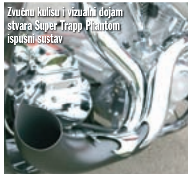
Zvučnu kulisu i vizualni dojam stvara Super Trapp Phantom ispušni sustav

ne, S&S Shorty Super G rasplinjača te IST elektronike znači da Centaurus raspolaze s 112 konjskih snaga te 124 Nm. Naravno, ako nekome nije jasno, riječ je o V2 agregatu s cilindrima pod