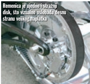
Remenica je ujedno i stražnji disk, što vizualno oslobađa desnu stranu velikog naplatka