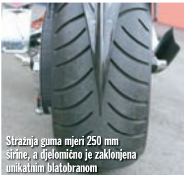
Stražnja guma mjeri 250 mm širine, a djelomično je zaklonjena unikatnim blatobranom