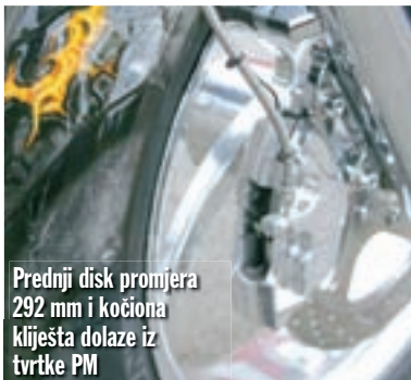
Prednji disk promjera 292 mm i kočiona klijesta dolaze iz tvrtke PM