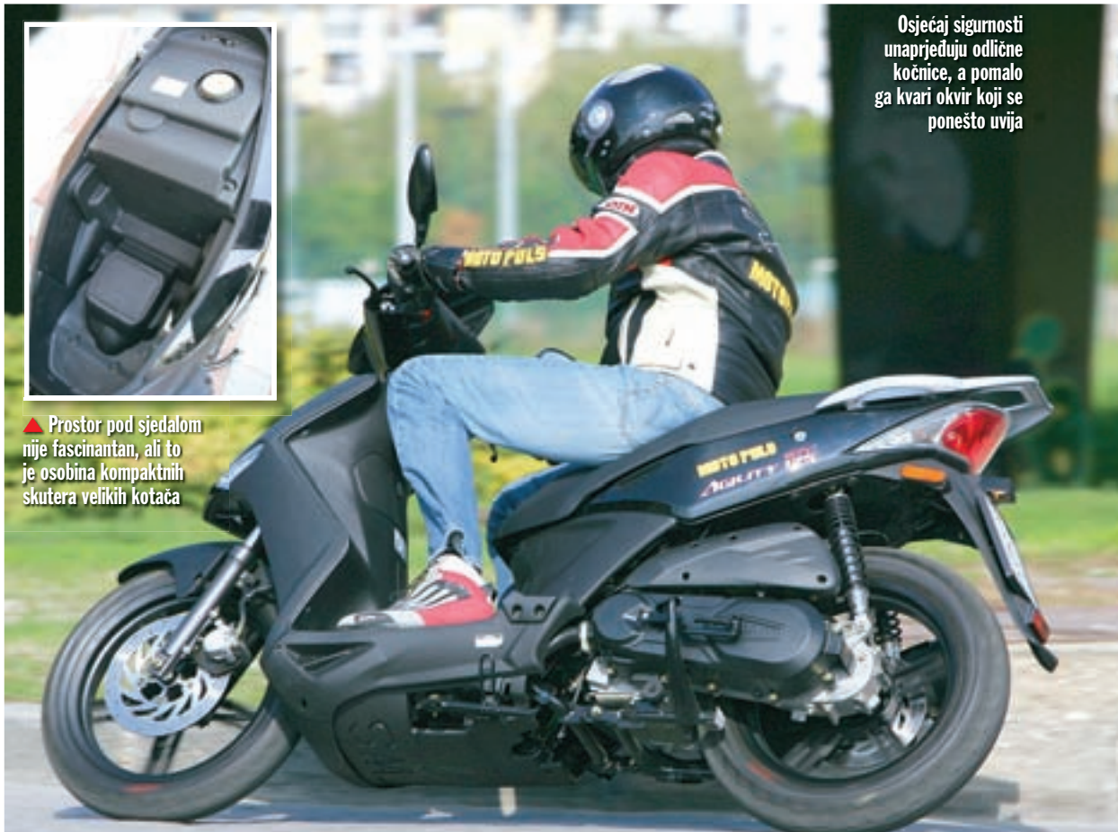
Osjećaj sigurnosti unaprijeđuju odlične kočnice, a pomalo ga kvari okvir koji se ponešto uvija