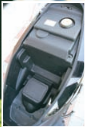
▲ Prostor pod sjedalom nije fascinantn, ali to je osobina kompaktnih skutera velikih kotača

Nije važno što ovakva tehnička rješenja neće osigurati neke neslućene količine snage, a tehnofili će ostati posve ravnodušni. Bitno je da skuter svaki puta lako upali i uz neveliku potrošnju goriva (koje spremno poskupljuje, ali nevoljko pojeftinjuje) preveze korisnika od poslovične točke A do točke B. Navedenim uvjetima udovoljava i jednocilindrični zrakom hlađeni agregat, koji pogoni skuter koji je pred nama. Provrt od 52,4 mm te nešto veći hod, koji iznosi 57,8 mm, zajedničkim naporima ostvaruju radni obujam od 125 kubičnih centimetara. U skladu s ostalom provjerenom, ali ne i pretjerano naprednom tehnologijom, u glavi motora se