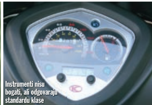
Instrumenti nisu bogati, ali odgovaraju standardu klase