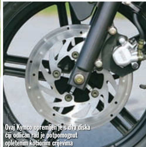
Ovaj Kymco opremljen je s dva diska čiji odličan rad je potpomognut opletenim kočionim crijevima