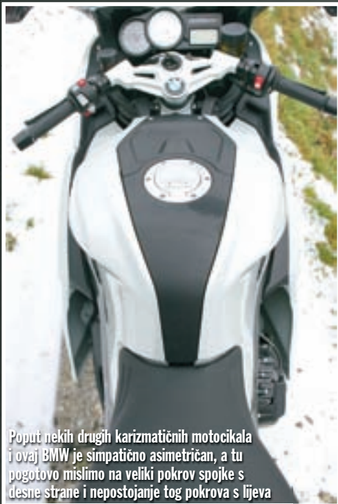
Poput nekih drugih karizmatičnih motocikala i ovaj BMW je simpatično asimetričan, a tu pogotovo mislimo na veliki pokrov spojke s desne strane i nepostojanje tog pokrova s lijeva