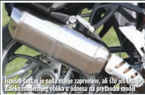
Ispušni sustav je sada manje zapremine, ali što još bitnije, daleko modernijeg oblika u odnosu na prethodni model