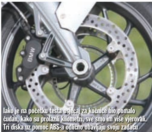
Iako je na početku testa osjećaj za kočnice bio pomalo čudan, kako su prolazili kilometri, sve smo im više vjerovali. Tri diska uz pomoć ABS-a odlično obavljaju svoju zadaću

ko drugi će od sportskog motocikla očekivati iznimnu okretnost po zavojima, dok će neka hipotetska treća osoba biti sretna velikom krajnjom brzinom. Naravno da je i turistička komponenta podložna raznim tumačenjima, pa će netko očekivati udoban položaj sjedenja, a netko odličnu zaštitu od vjetra. BMW koji je predmet ovog testa nudi od svega po malo i u nedostatku bolje podjele svrstati ćemo ga među sportsko-turističke motocikle. U popratnom materijalu stručnjaci iz BMW-a hvale svoga konja, pa kažu da ga odlikuju "sportske i dinamične vozne osobine uz vrhunsku udobnost...", što je dovoljno široka izjava, pa ju nećemo kritizirati. Zato marketinški stručnjaci očitno ne voze motocikle, jer za ovu grdosiju kažu kako se odlikuje "zaigranom i lakom upravljivošću uz potpunu stabilnost". Dok spomenutih četvrt tone i pozamašni međuosovinski razmak nesumnjivo garantiraju stabilnost, okretnost je nešto što gotovo nema smisla niti spominjati uz ovakav motocikl. Daleko od toga da se radi o nedostatku, ali već prvi pogled na impozantne dimenzije zatire