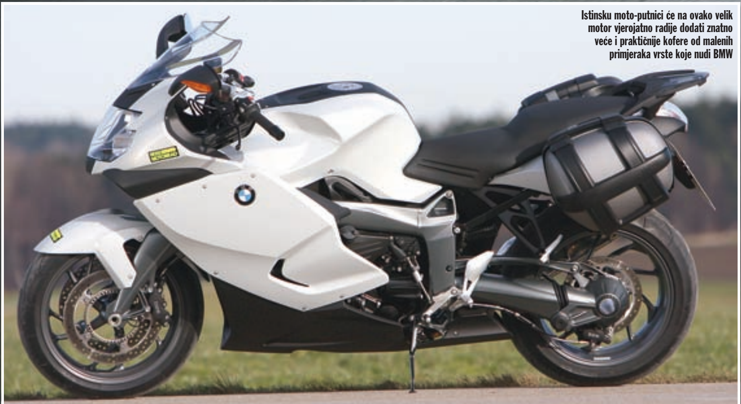
Istinsku moto-putnici će na ovako velik motor vjerojatno radije dodati znatno veće i praktičnije kofere od malenih primjeraka vrste koje nudi BMW

Niti nakon cijelog dana vožnje ovaj motocikl nam nije dosadio, već nas je neprestano zabavljao, što svojim tehnološkim začinima, što fascinantnim ubrzanjima. Radi se o motociklu koji će umjerenim vozačima pružiti daleko više nego se nadaju, a istovremeno će doradjeni ABS i ASC jamčiti dodatnu dozu sigurnosti onima manje iskusnima. Čak i iskusni vozač će profitirati od ovih pomagala, a raspoloživa snaga te još naglašeniji zakretni moment znače da će užitka u vožnji uvijek biti. Čak i na zatvorenijim dijelovima pro-