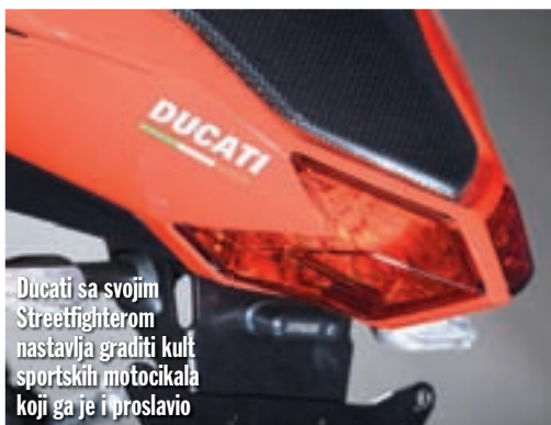
Ducati sa svojim Streetfighterom nastavlja graditi kult sportskih motocikala koji ga je i proslavio

Vezano uz pogonsku grupu, ne smijemo zaobići ni novi hladnjak tekućine koji krasi Streetfigtera, a koji se zbog izrazito uske frontalne siluete motocikla sada sastoji iz dva dijela. Još jedno rješenje