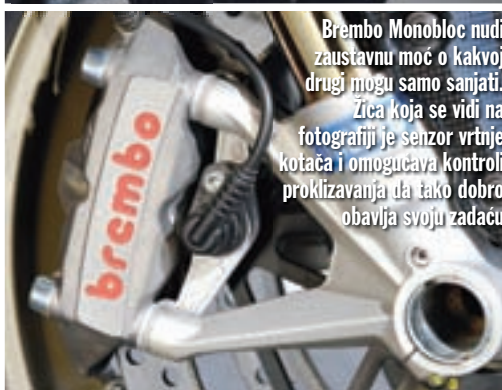
Brembo Monobloc nudi zaustavnu moć o kakvoj drugi mogu samo sanjati. Žica koja se vidi na fotografiji je senzor vrtnje kotača i omogućava kontroli proklizavanja da tako dobro obavlja svoju zadaću