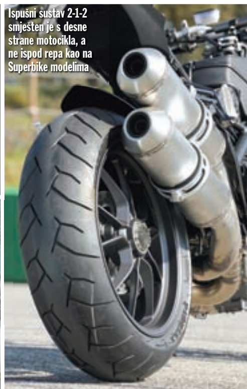
Ispušni sustav 2-1-2 smješten je s desne strane motocikla, a ne ispod repa kao na Superbike modelima

koje odskače od Superbike modela je ispušni sustav smješten s desne strane Streetfightera. Izveden je prema uvriježenoj formuli 2-1-2, a izrađen od nehrđajućeg čelika debljine jednog milimetra, dok su njegove cijevi promjera od 58 do 63,5 mm.