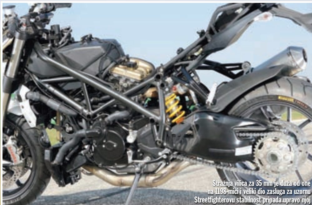
Stražnja vilica za 35 mm je duža od one na 1198-mici i veliki dio zasluga za uzornu Streetfighterovu stabilnost pripada upravo njoj

Riječ-dvije i o agregatu, koji ima posve drukčiji karakter od onoga kakvoga smo upoznali na 1098-mici. Ima točno pet konjskih snaga manje, a