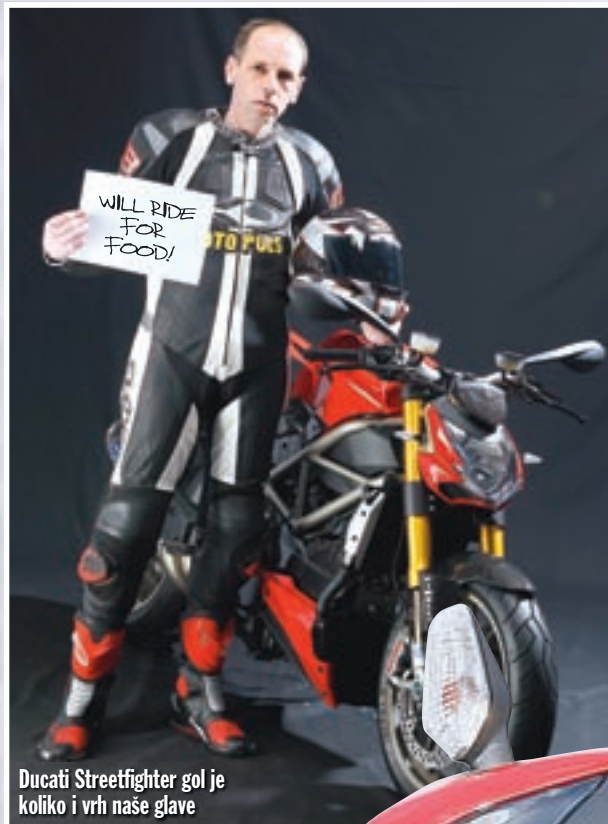
Ducati Streetfighter gol je koliko i vrh naše glave

Testirali smo Ducati Streetfighter, motocikl koji uspješno objedinjuje filozofiju ultra sportaša s dušom nakada i pomiče granice sportske vožnje kakve su dosad bile uvriježene za ovaj tip motocikala. Na prvi pogled to je tek ogoljeni 1098, no zapravo se radi o posve jedinstvenom motociklu koji ne prestaje mamiti osmijeh na lice vozača i pomiče granice mogućnosti vozila na dva kotača. Uz vrhunske Öhlinsove elemente ovjesa neslućene brzine osigurava i vrhunska Ducatijeva kontrola proklizavanja