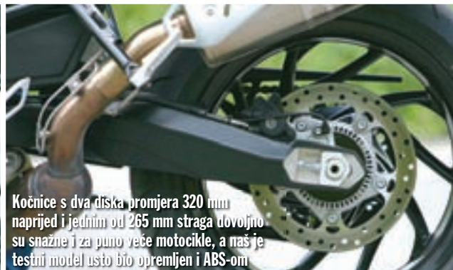
Kočnice s dva diska promjera 320 mm naprijed i jednim od 265 mm straga dovoljno su snažne i za puno veće motocikle, a naš je testni model isto bio opremljen i ABS-om