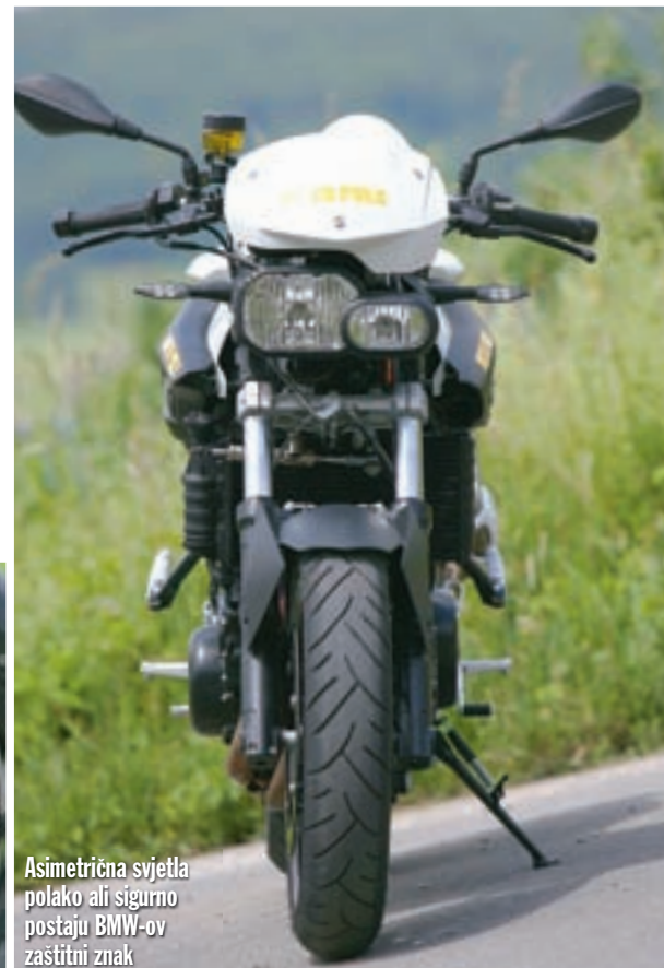
Asimetrična svjetla polako ali sigurno postaju BMW-ov zaštitni znak

karakteristike motora već otprije poznate s ostalih BMW-ovih agregata iz ove serije, no novost koju donosi F 800 R je unaprijeđeno ubrizgavanje goriva s novim sustavom upravljanja gasom, koje omogućava još osjetljiviji i nežešnji odaziv agregata na otvaranje ručice gasa, osobito u nižim režimima rada.