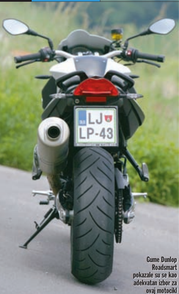
Gume Dunlop Roadsmart pokazale su se kao adekvatan izbor za ovaj motocikl