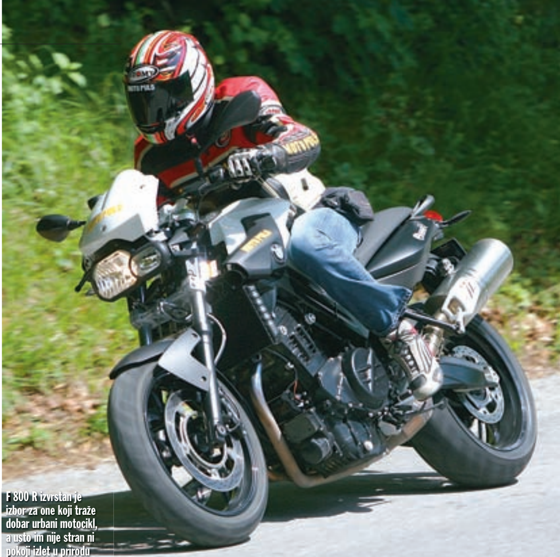
F 800 R izvrstan je izbor za one koji traže dobar urbani motocikl, a usto im nije stran ni pokoji izlet u prirodu

samoga motocikla, za ostatak ovjesa imamo samo riječi hvale. Vilica je čvrsta, ali ne i tvrda te ne umanjuje udobnost nauštrb dobrih voznih osobina.