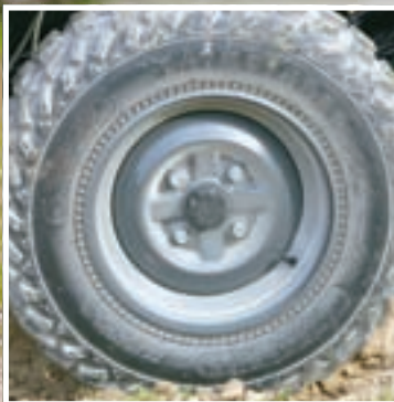
Svojim ne pretjerano gubim profilom montirane gume predstavljaju dobar odabir za cestu i prašnjave terene, no na raskvašenoj podlozi bi mogle imati dosta problema