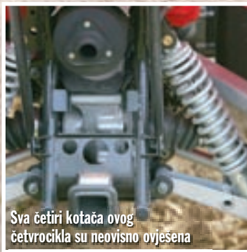
Sva četiri kotača ovog četverocikla su neovisno ovješena

mobilskom stilu i pritom istovremeno aktivirati sva tri diska, dok će oni iskusniji pomoću ručica uobičajeno smještenih s desne i lijeve strane upravljača odvojeno koristiti usluge dva prednja i jednog stražnjeg diska. Uostalom, neovisnost prednjih od stražnjeg diska nije samo prijeko potrebna za sigurno uživanje u nešto agresivnijoj vožnji, već je i sasvim u skladu s općim slobodarskim duhom ovog četverocikla određenog potpuno neovisnim ovjesom.