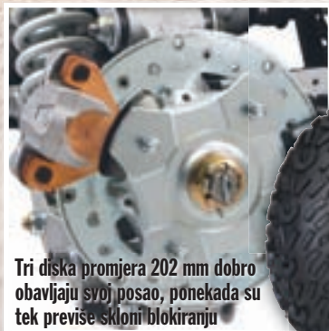
Tri diska promjera 202 mm dobro obavljaju svoj posao, ponekada su tek previše skloni blokiranju