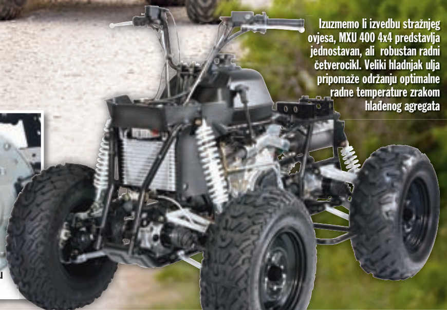
Izuzmemo li izvedbu stražnjeg ovjesa, MXU 400 4x4 predstavlja jednostavan, ali robustan radni četverocikl. Veliki hladnjak ulja pripomaže održanju optimalne radne temperature zrakom hlađenog agregata