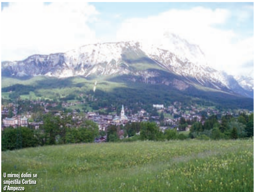
U mirnoj dolini se smjestila Cortina d'Ampezzo

Nakon zavoja od kojih 180 stupnjeva ubrzavamo do trećeg stupnja prijenosa da bi uslijedilo snažno kočenje, spuštanje u „prvu“ i zavoj od 190 stupnjeva. Iako će nekome ovo sve zvučati dosadno i monotono, istina ne može biti dalje, jer svaki zavoj je različit, kao i ravni komad ceste koji ih spaja, a i pogled se stalno mijenja. Čas jurimo kroz šumu, čas kroz pomalo pust kamenjar, zatim pored predivnog (zasigurno užasno hladnog) planinskog jezera, pa kroz „galeriju“ izliječemo na visoravan.