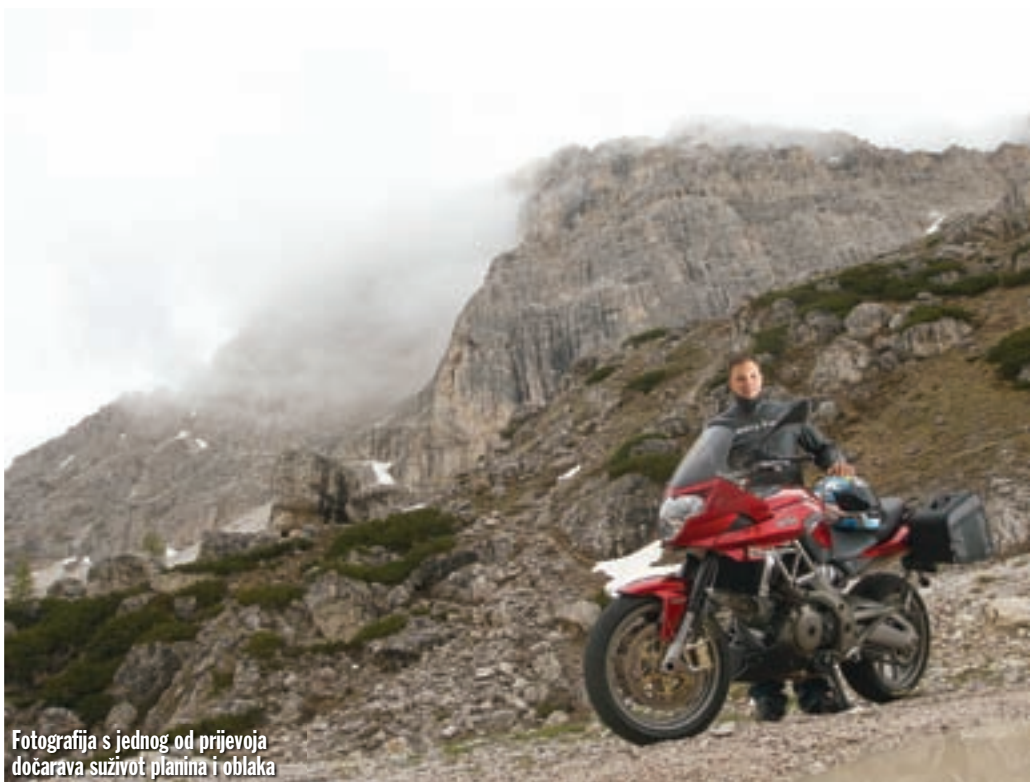
Fotografija s jednog od prijevoja dočarava suživot planina i oblaka

ovako zabavna prometnica prolazi kroz neki fiktivni posve prazan prostor, nesumnjivo bismo uživali. Kada vas ista ta cesta vodi gore - dolje po moćnim planinama, veselju gotovo da nema kraja. Ukoliko ste sretno zaljubljeni, poznat vam je osjećaj kada vidite nešto jednostavno predivno pa pomislite kako bi bilo divno da ona / on to sada može vidjeti. E, pa takvih prizora ima barem 10 na svakom kilometru koji smo prošli. Na vrhovima planina igraju se boje kamena prošarane poljima snježne bijeline, a samo da bi im ludo zelene visoravni ponudile savršeni kontrast. Ne bi bilo pošteno zaboraviti niti oblake koji zapinju za vrhove ili im nastaju „na ramenu“, ili plavo nebo u kojem smo također mogli uživati.