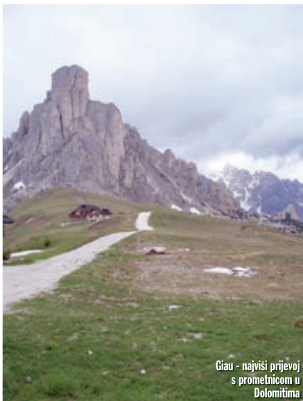
Giau - najviši prijevoj s prometnicom u Dolomitima