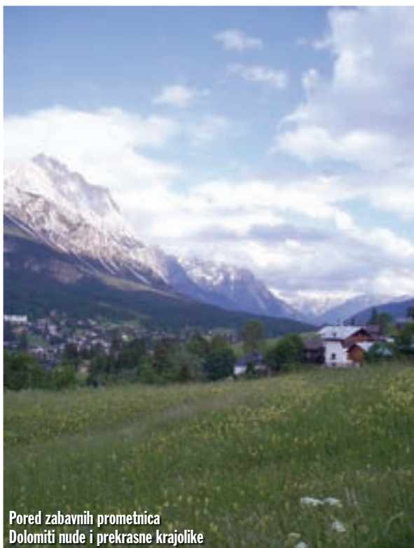
Pored zabavnih prometnica Dolomiti nude i prekrasne krajolike