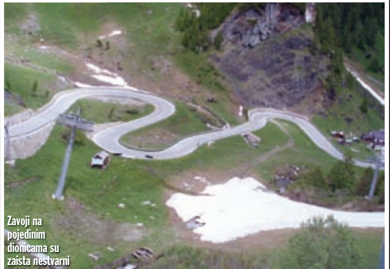
Zavoji na pojedinim dionicama su zaista nestvarni