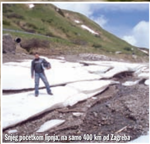
Snjeg početkom lipnja, na samo 400 km od Zagreba

Zamislite mjesto gdje ćete i za kišnog vremena naići na stotine istomišljenika koji su došli uživati u savršenim cestama kroz predivne krajolike. Ako se odlučite na put u gorje Dolomiti na sjeveru Italije, nećete morati zamišljati, već samo uživati