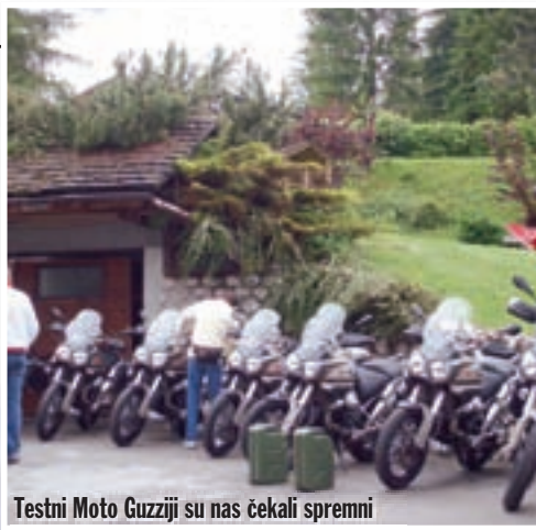
Testni Moto Guzziji su nas čekali spremni