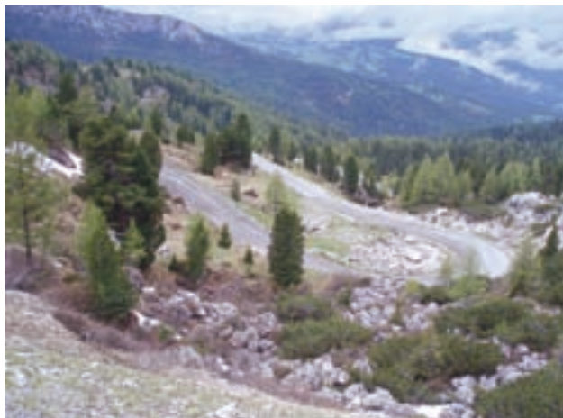
Zimi skijališta, ljeti poligoni za motoriste