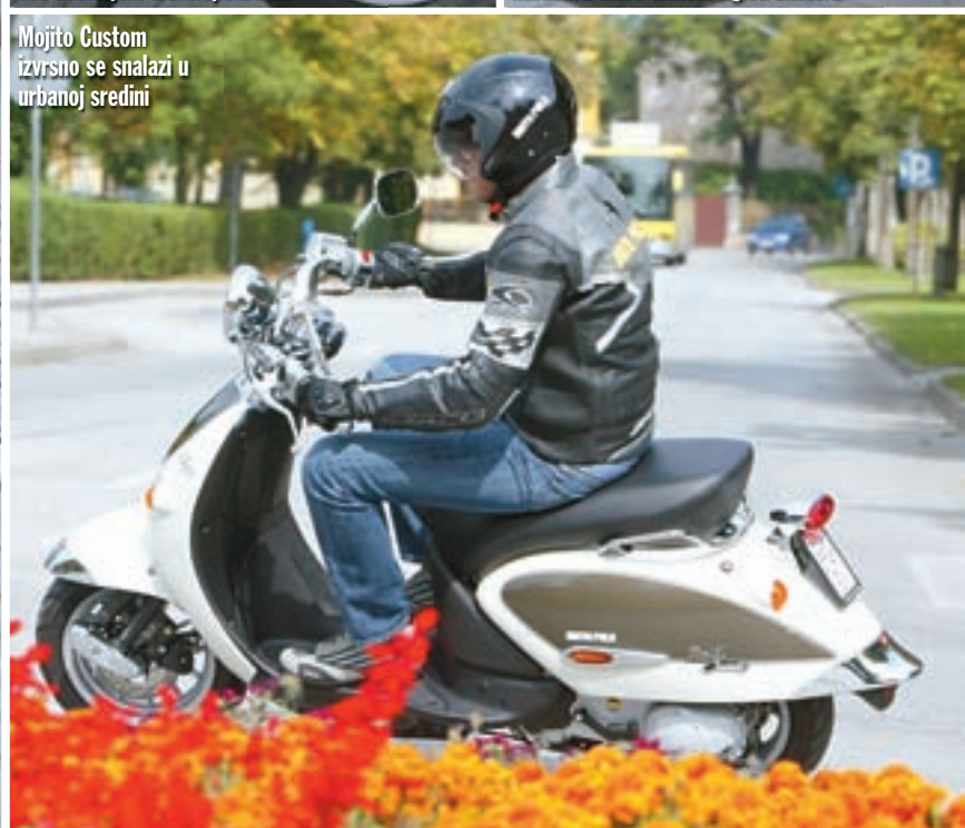
Mojito Custom izvrsno se snalazi u urbanoj sredini