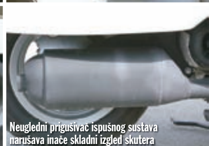
Neugledni prigušivač ispušnog sustava narušava inače skladni izgled skutera