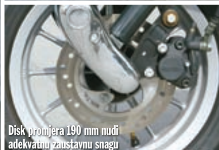
Disk promjera 190 mm nudi adekvatnu zaustavnu snagu