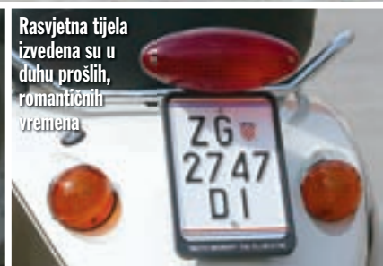
Rasvjetna tijela izvedena su u duhu prošlih, romantičnih vremena