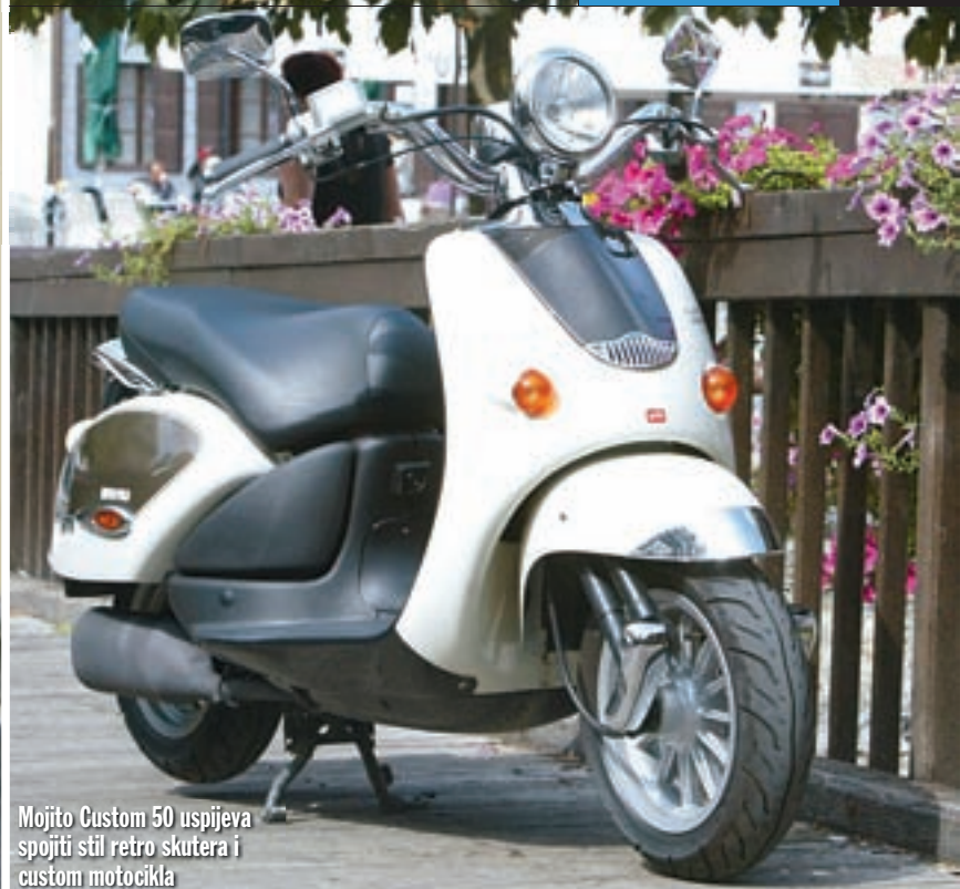
Mojito Custom 50 uspijeva spojiti stil retro skutera i custom motocikla

Naime, taj je osjećaj neopravdan stoga što se pod maštovitim Mojitovim oplatama krije jedan sasvim prosječan dvotaktni agregat zapremine 49 kubičnih centimetara, koji svojim performansama nikoga neće ostaviti bez daha. To je i u redu jer se od jednoga takvog skutera ni ne očekuje obaranje brzinskih rekorda. No, vjerujemo da nitko neće ostati ni previše razočaran s Mojitovih deklariranih 4,3 konjske snage, koje agregat uspijeva istisnuti pri 6,750 okretaja u minuti, dok je maksimalni okretni moment jednako skromnih, ali za ovu klasu i posve očekivanih 4,7 Nm pri 7,750 okr/min. U svakom slučaju, performanse su u skladu s očekivanjima, ni veće ni manje, a to znači da je Mojito sasvim primjereno prometalo za vožnju u gradskim gužvama ili kroz vaš omiljeni kvart. Agregat će bez problema postići brzinu od nekih 50-ak kilometara na sat, baš kao i većina drugih skutera u ovoj klasi. Za one koji od svoga ljubimca žele jače performanse ili se povremeno žele uputiti na neko udaljenije odredište, Aprilia je ponudila primjerenije rješenje u obliku četverotaktnog Mojita 125. Svoju sreću na Mojitu 125 mogli bi pronaći i oni koji malo teže podnose buku,