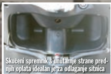
Skućeni spremnik s unutarnje strane prednjih oplata idealan je za odlaganje sitnica

S Mojitom ćete zasigurno biti primijećeni, ma gdje da se pojavili