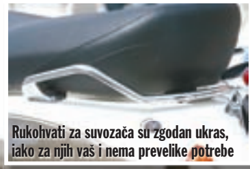
Rukohvati za suvozača su zgodan ukras, iako za njih vaši i nema prevelike potrebe